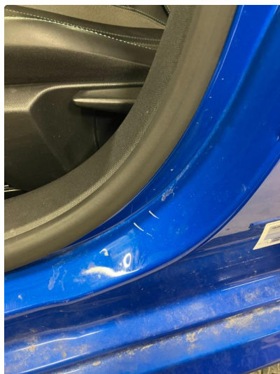
1.1 Øvrige feil Kommentar: Ripene er penslet