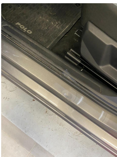
1.2 Bulk(er) med lakkskade