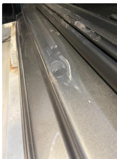
1.2 Bulk(er) med lakkskade