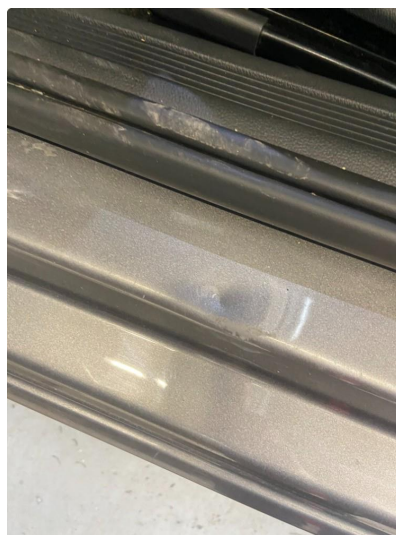
1.2 Bulk(er) med lakkskade