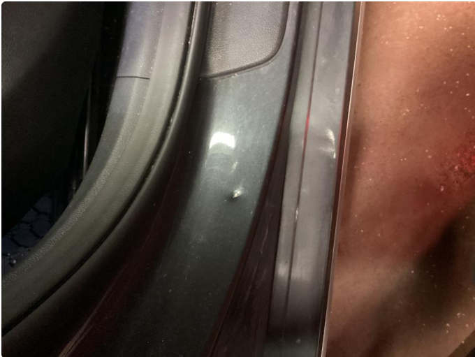
1.1 Bulk Innsteg