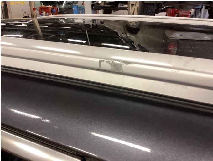
1.2 Merke etter lastestativ