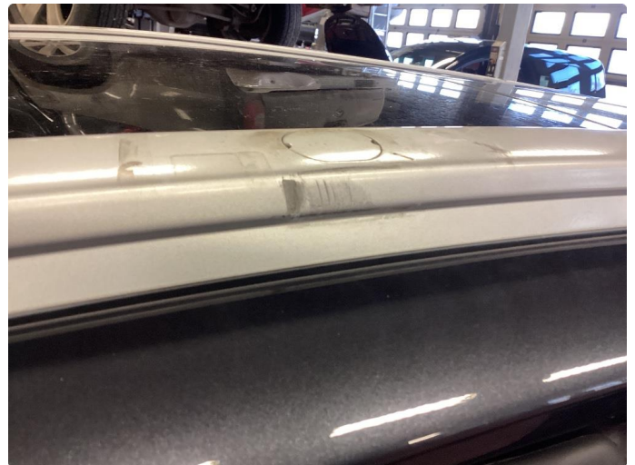
1.2 Merke etter lastestativ