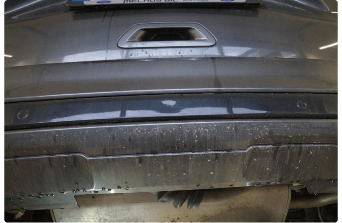
1.1 Minibulk nedre del bakfanger