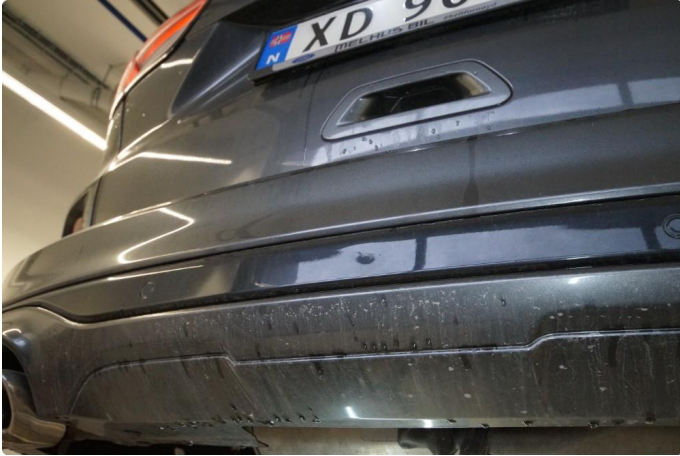
1.1 Minibulk nedre del bakfanger