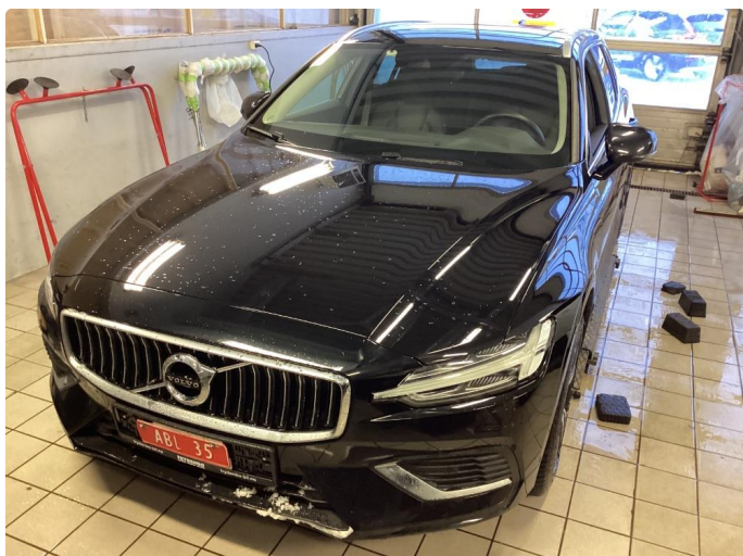
1.1 Steinsprut i synsfelt. Byttet