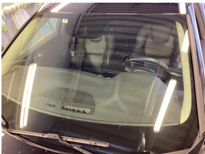
1.1 Steinsprut i synsfelt. Byttet