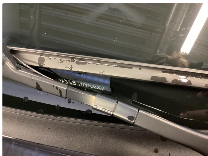
1.1 Steinsprut i synsfelt. Byttet