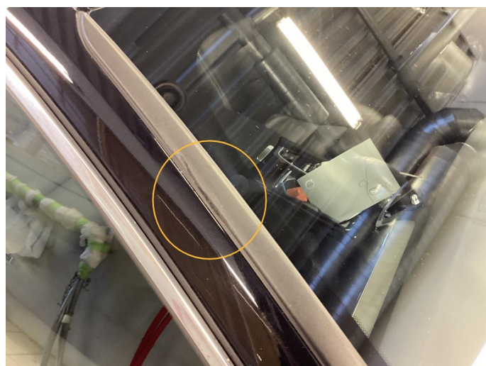
1.2 Øvrige feil. Byttet