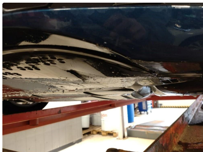
1.4 Skrubbskader underkant