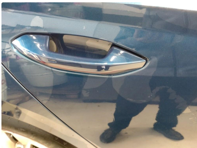
1.1 Håndtak lakkskadet/flasser