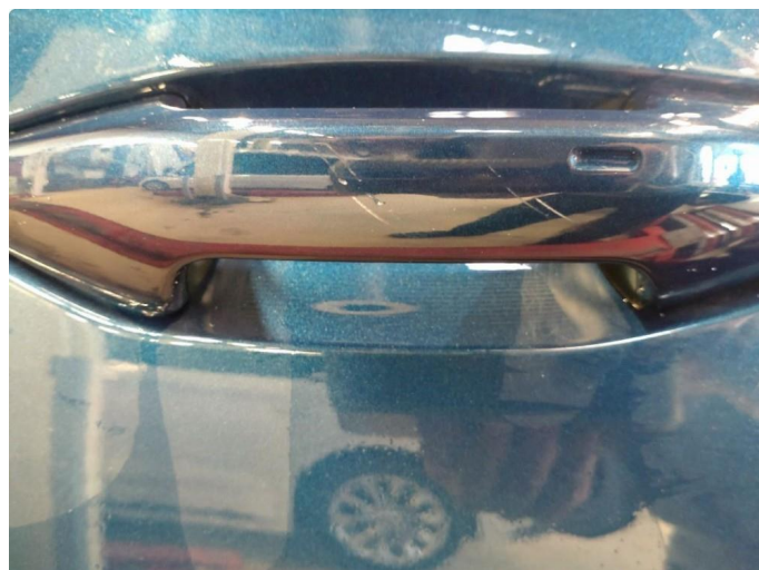
1.2 Håndtak lakkskadet/flasser