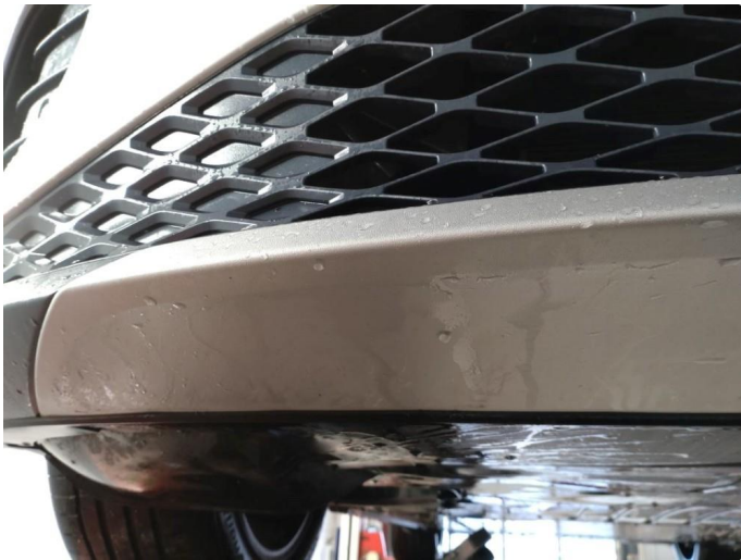
1.1 Skrubbskader underkant