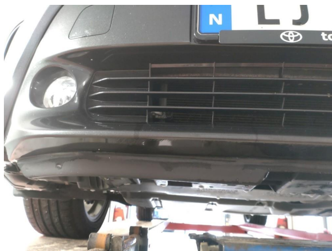
1.6 Skrubbskader underkant