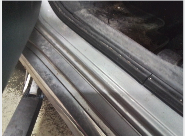
2.5 Gjennomslitt lakk innsteg førerdør