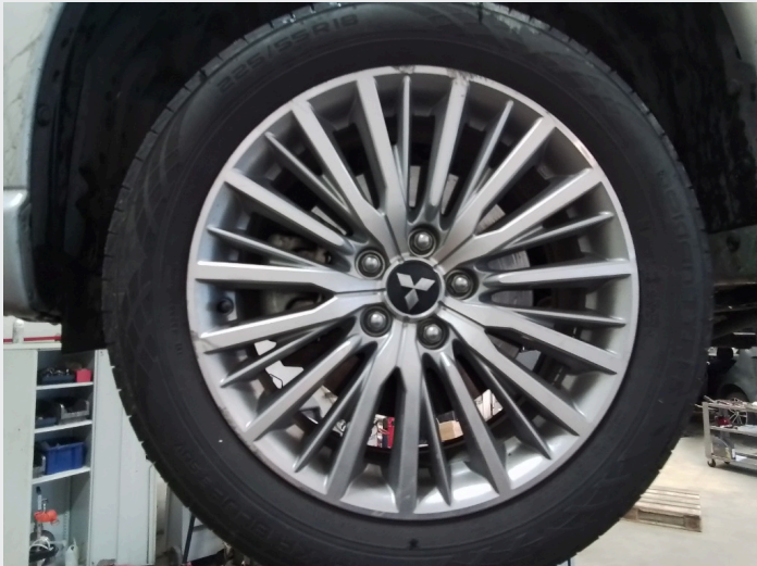
2.18 Kantkjørt felg venstre foran