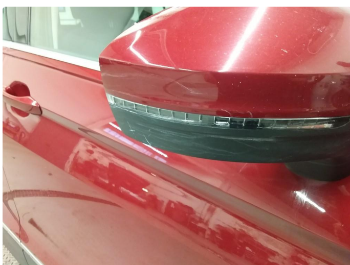
1.3 Speilhus riper