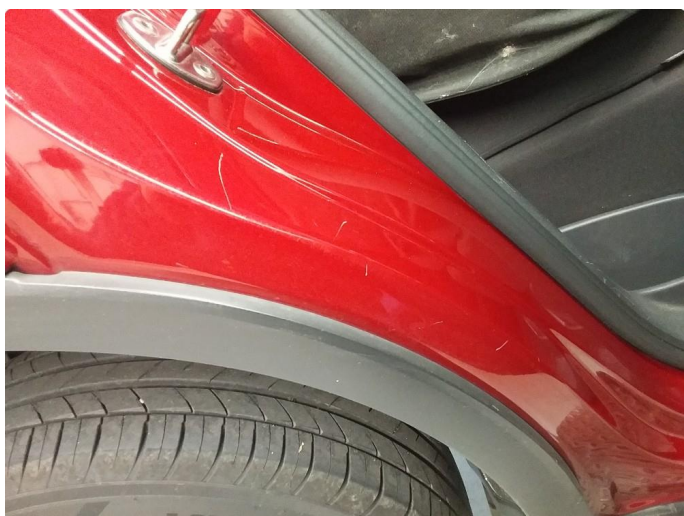
1.4 Noen riper og småbulker