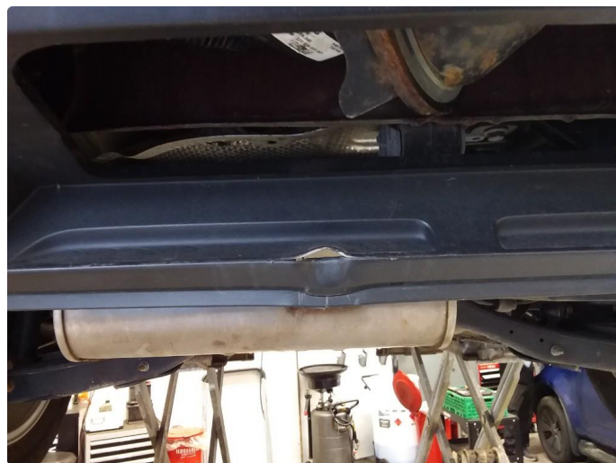
1.5 Lister skadet/mangler