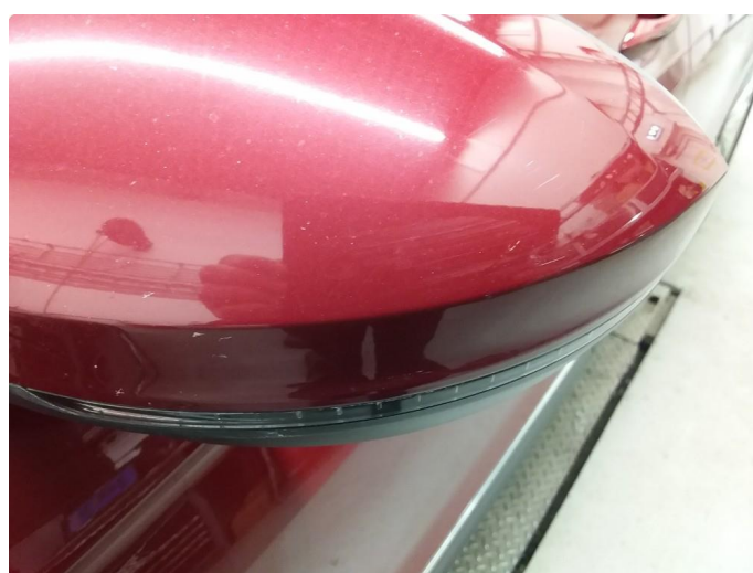
1.3 Speilhus riper