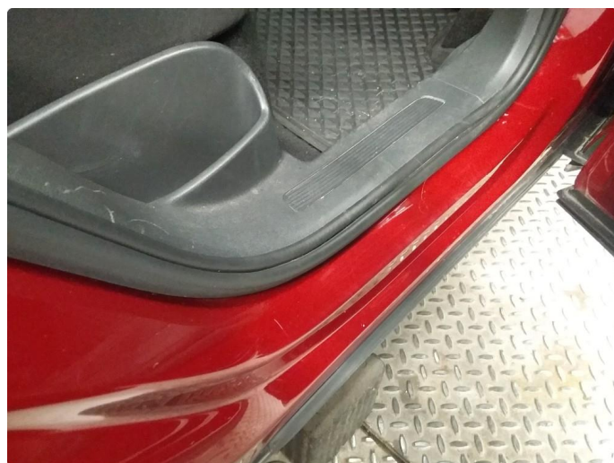
1.4 Noen riper og småbulker