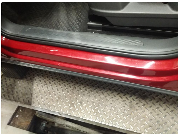
1.4 Noen riper og småbulker