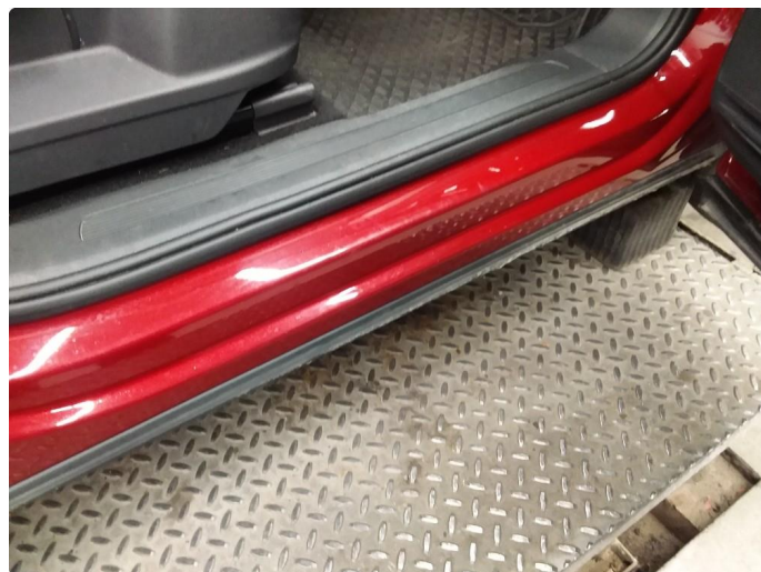
1.4 Noen riper og småbulker