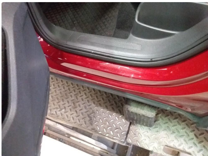
1.4 Noen riper og småbulker