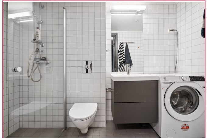
Flislagt bad med varmekabler.