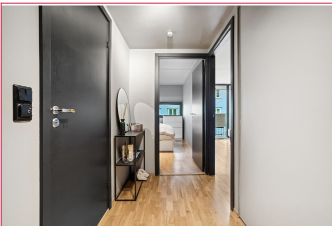
Romslig entrè med plass til klær og sko.