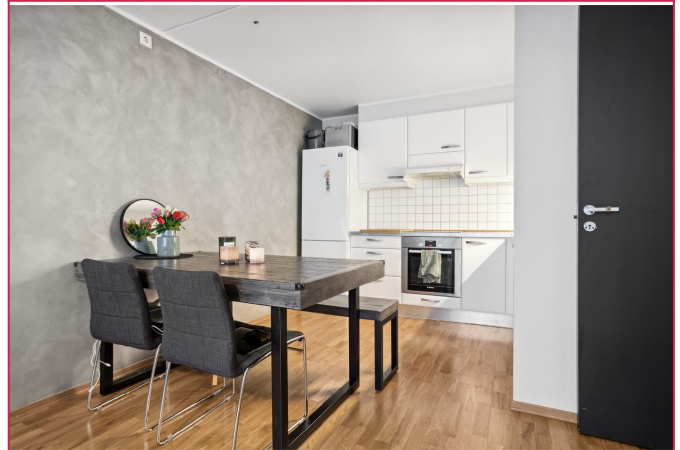
Leiligheten er delvis møblert.