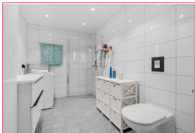
Innbydende flislagt bad med varmekabler i gulv.