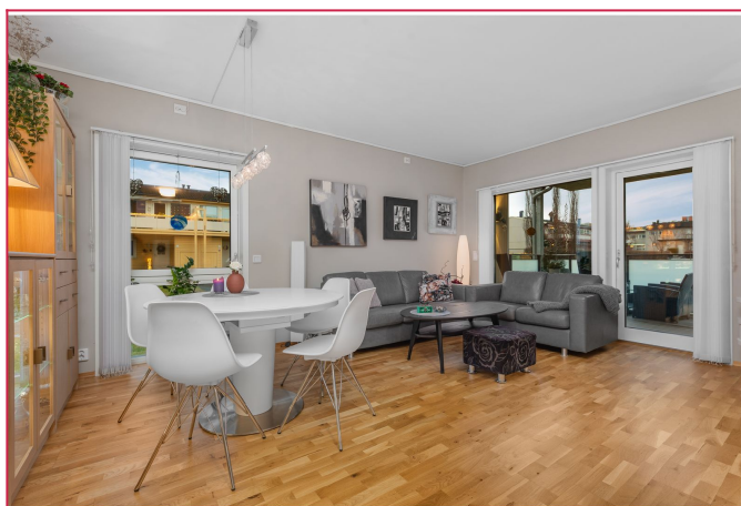
Stue med utgang til veranda