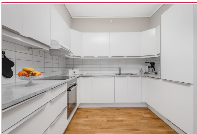
pent kjøkken , godt med benkeplass.