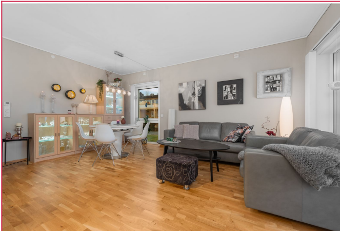
Romstor stue med plass til det du måtte ønske.