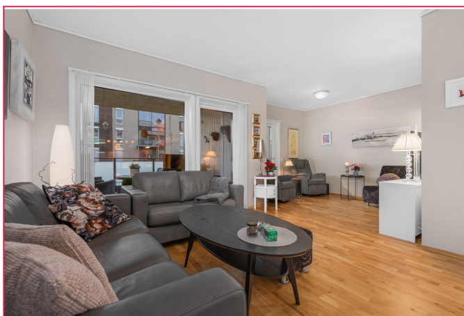
Fjernvarmeoppdatering i hele leiligheten.