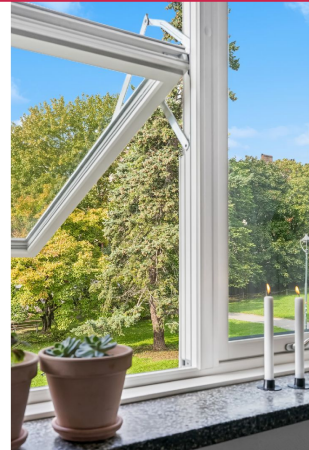
Hyggelig utsyn fra leiligheten.