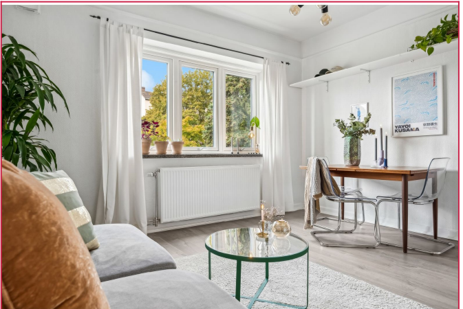
Oppvarming og varmtvann er inkludert i husleien.