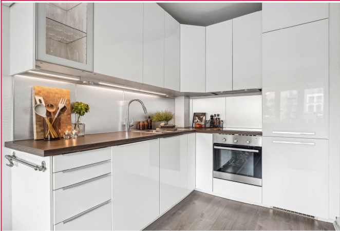
Kjøkkenet har integrerte hvitevarer.