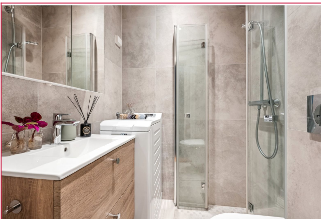
Pent bad med opplegg for vaskemaskin.