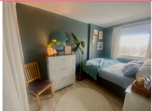
Romslig soverom malt i tidsriktige og behagelige farger.