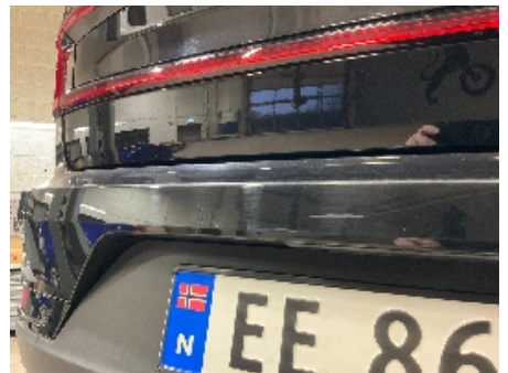
33. Lakk / karosseri utvendig