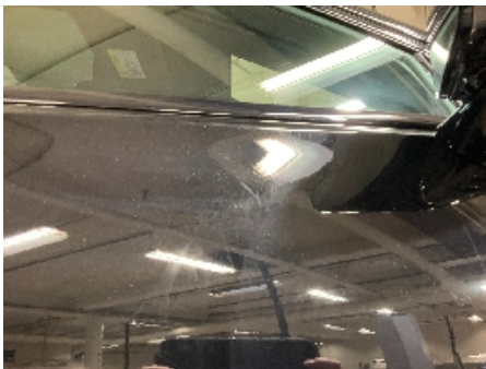
31. Lakk / karosseri utvendig