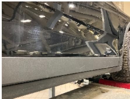
32. Lakk / karosseri utvendig