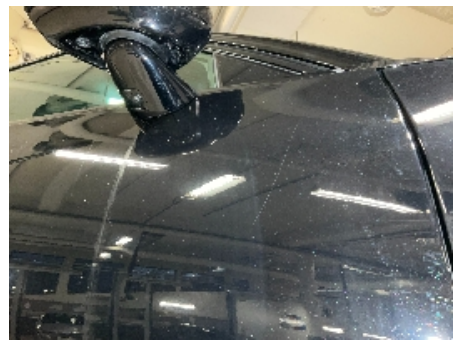
30. Lakk / karosseri utvendig