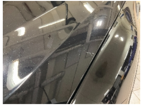
39. Lakk / karosseri utvendig