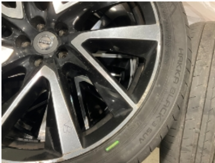
13. Ekstra hjulsett