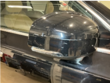
1. Utvendig speil