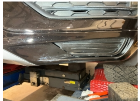
12. Lakk / karosseri utvendig