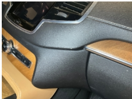
11. Dashbord / midtkonsoll