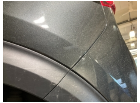
27. Lakk / karosseri utvendig