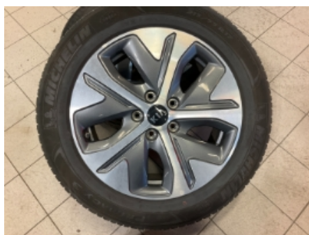
35. Ekstra hjulsett