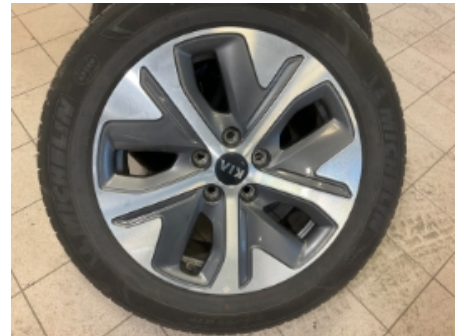
33. Ekstra hjulsett