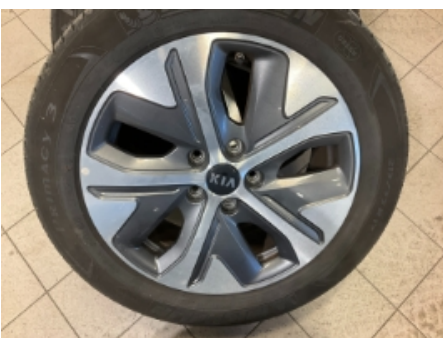
34. Ekstra hjulsett