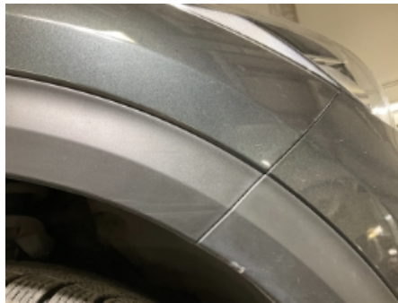
29. Lakk / karosseri utvendig