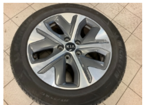
36. Ekstra hjulsett