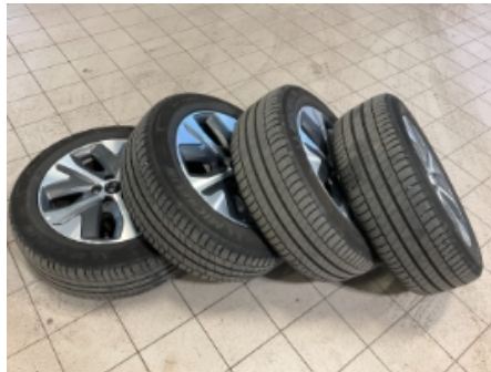
32. Ekstra hjulsett