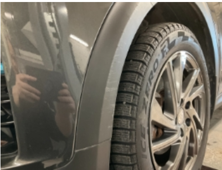
28. Lakk / karosseri utvendig