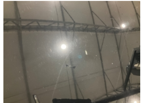
3. Lakk / karosseri utvendig