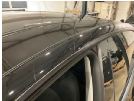
2. Lakk / karosseri utvendig