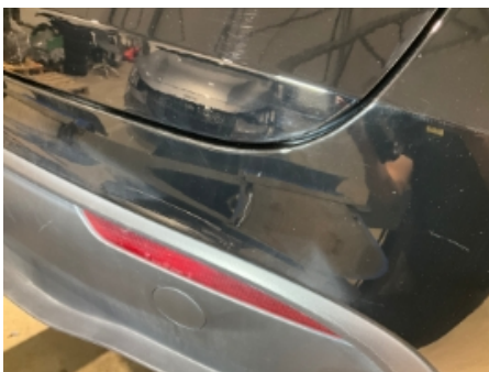
4. Lakk / karosseri utvendig