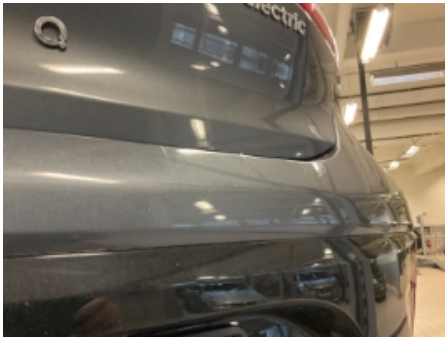
37. Lakk / karosseri utvendig