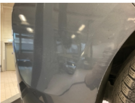
34. Lakk / karosseri utvendig