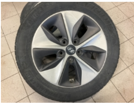
49. Ekstra hjulsett