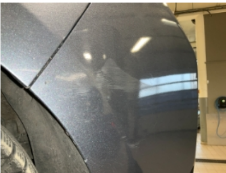
31. Lakk / karosseri utvendig