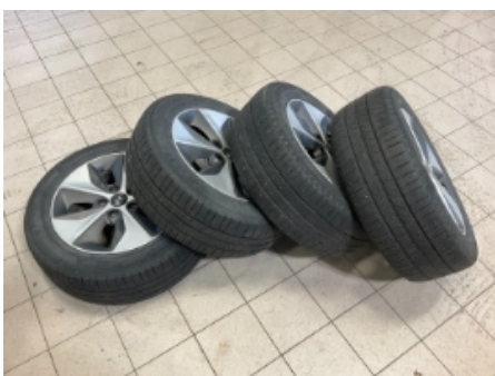
46. Ekstra hjulsett