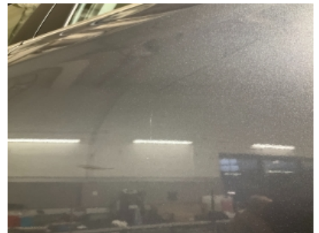
33. Lakk / karosseri utvendig