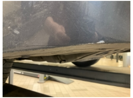
39. Lakk / karosseri utvendig