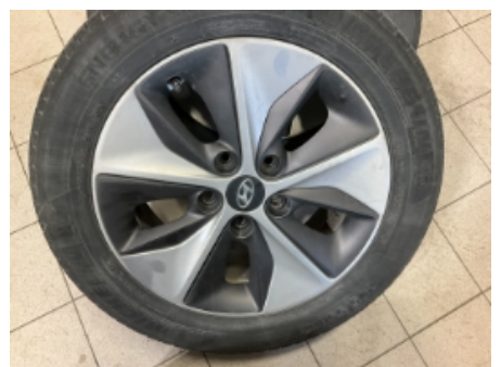
48. Ekstra hjulsett