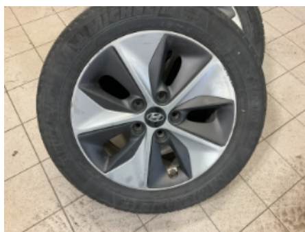
47. Ekstra hjulsett