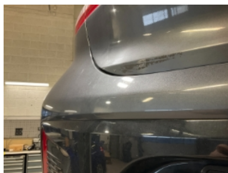
35. Lakk / karosseri utvendig