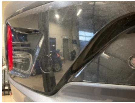
38. Lakk / karosseri utvendig