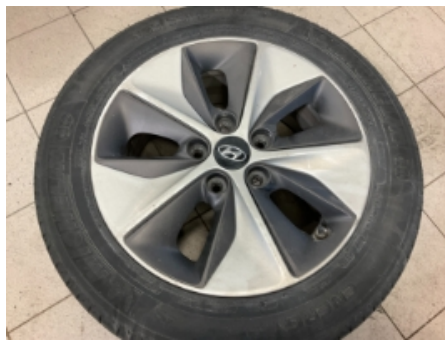
50. Ekstra hjulsett