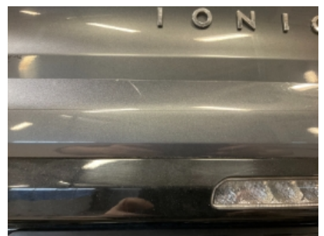
36. Lakk / karosseri utvendig