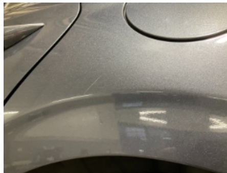
32. Lakk / karosseri utvendig