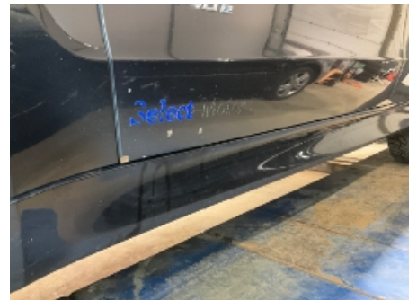
9. Lakk / karosseri utvendig