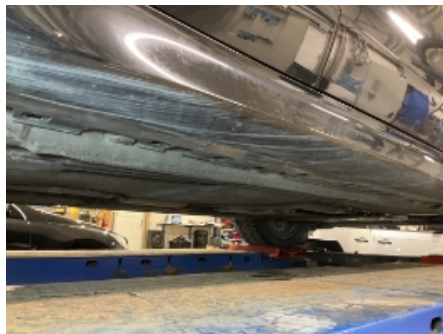
8. Lakk / karosseri utvendig