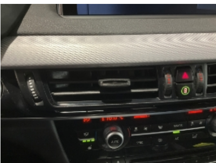
10. Luftdyse kupé