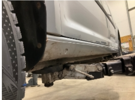
8. Venstre kanal