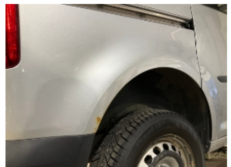
12. Høyre bakskjerm