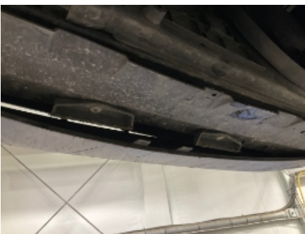
4. Støtfanger foran