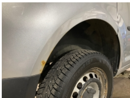
11. Lakk / karosseri utvendig