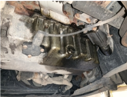
1. Utvendig tilstand motor