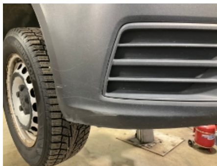
5. Støtfanger foran