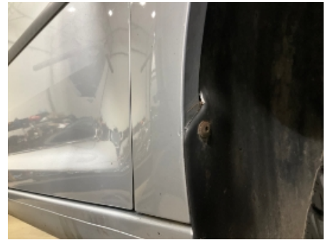
15. Høyre forskjerm