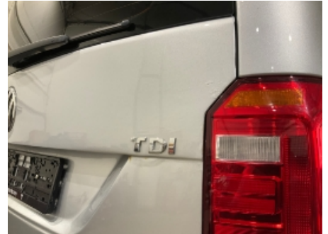
9. Lakk / karosseri utvendig