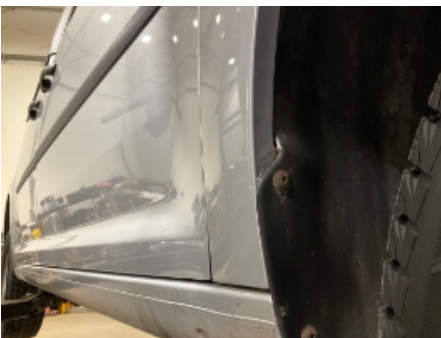
16. Lakk / karosseri utvendig