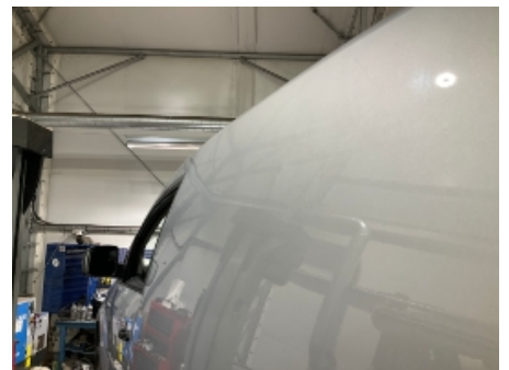
18. Venstre bakskjerm