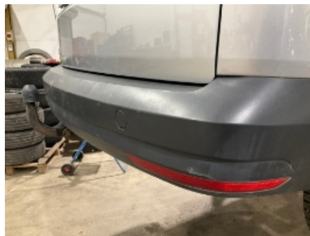
17. Støtfanger bak