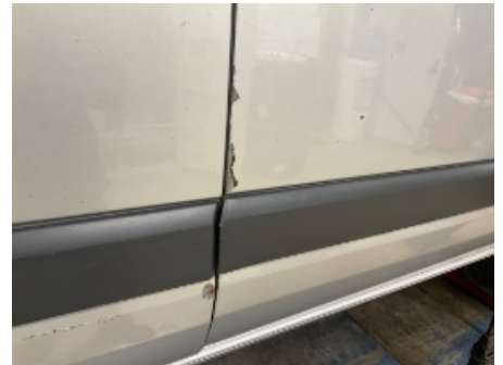
3. Lakk / karosseri utvendig