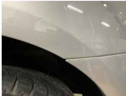
2. Lakk / karosseri utvendig