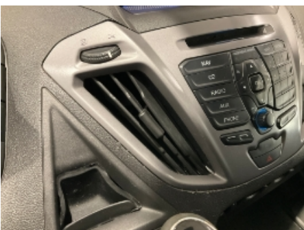
10. Luftdyse kupé