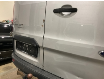
1. Lakk / karosseri utvendig