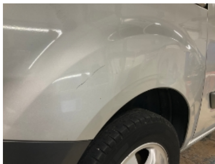
5. Lakk / karosseri utvendig