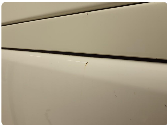
2.4 Bulk med lakkskade Tillegg rust h.bak