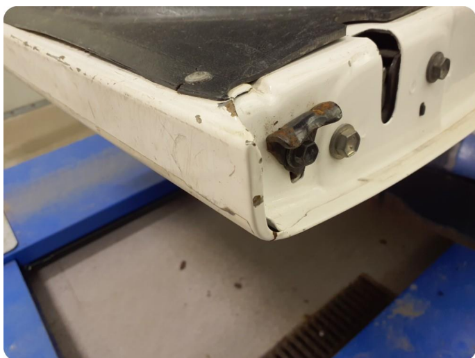
2.3 Bulk med lakkskade