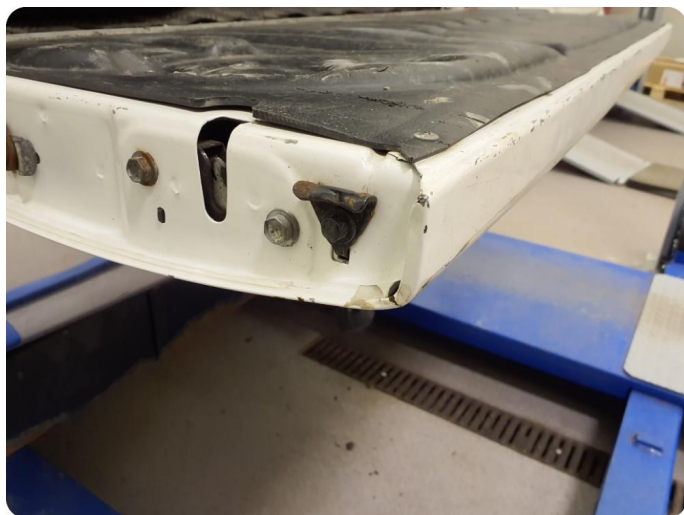
2.3 Bulk med lakkskade