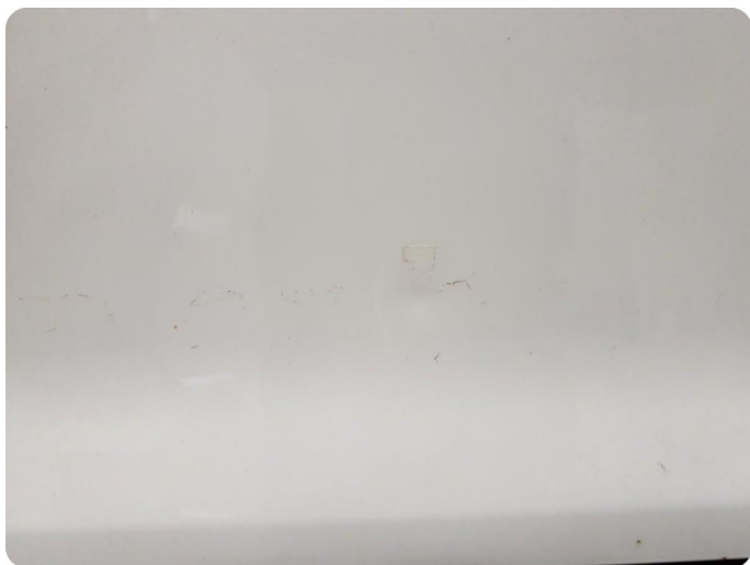
2.3 Bulk med lakkskade