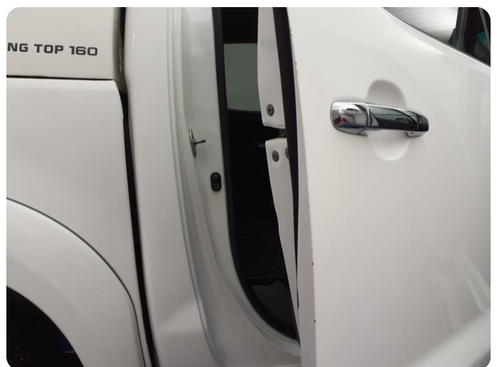
2.2 Ripe ned til grunning