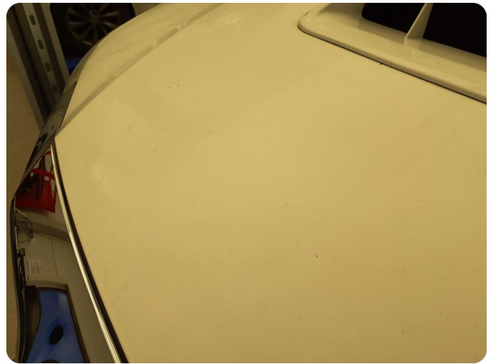
2.1 Noe steinsprut med rust