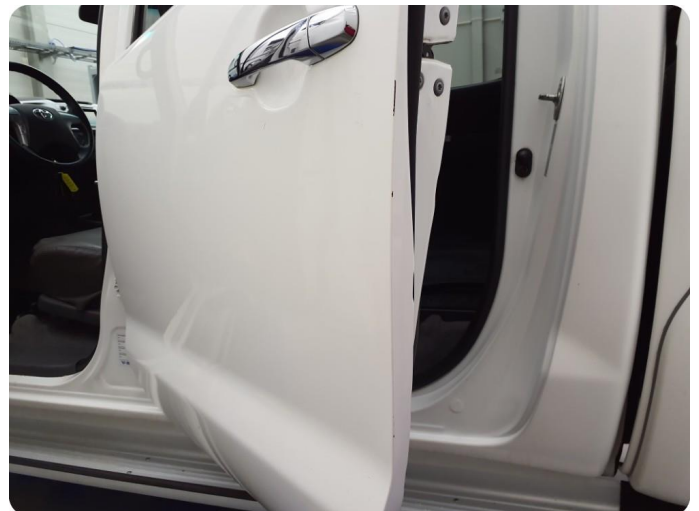
2.2 Ripe ned til grunning