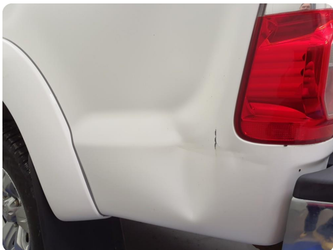
2.4 Bulk med lakkskade Tillegg rust h.bak