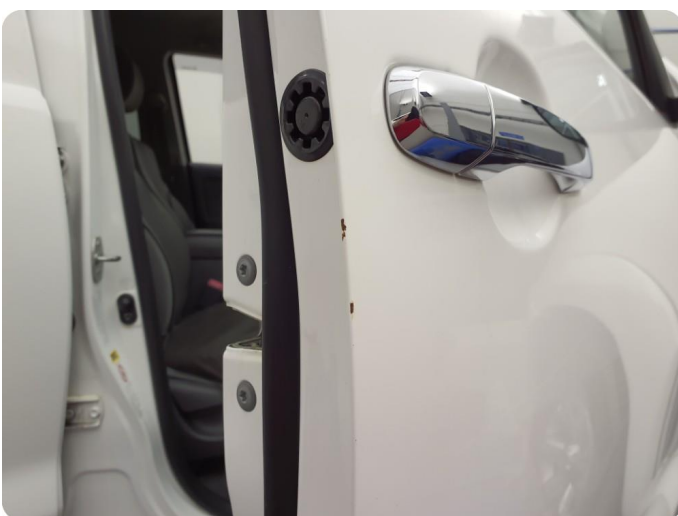
2.2 Ripe ned til grunning