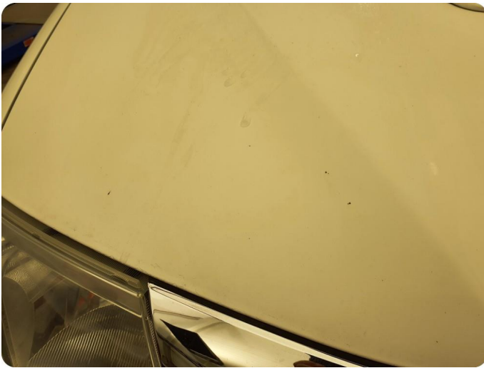
2.1 Noe steinsprut med rust