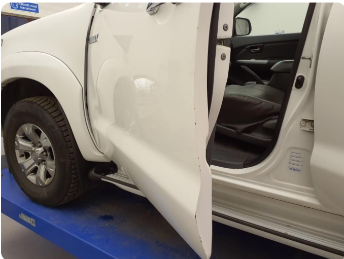
2.2 Ripe ned til grunning