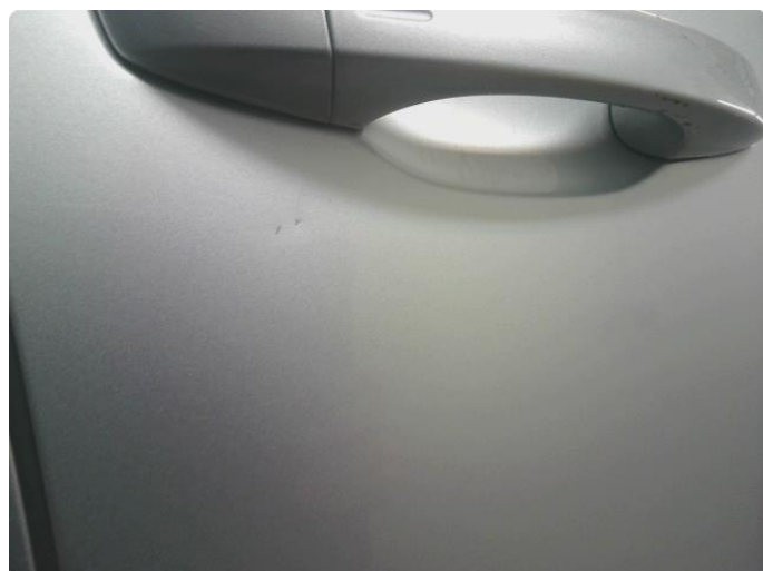
1.2 Bulk med lakkskade