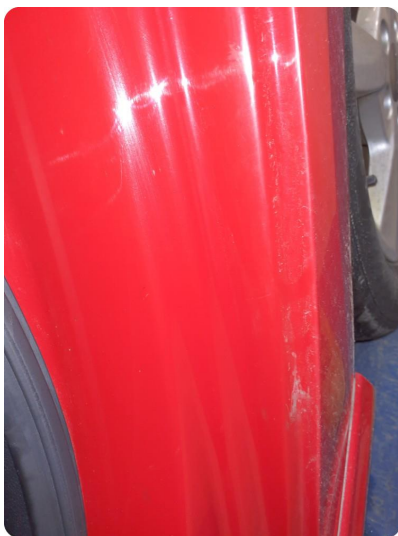
3.5 Ripe(r) Må kontrolleres