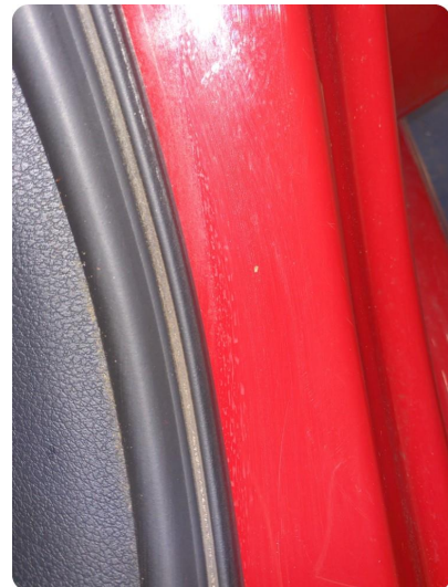
3.5 Ripe(r) Må kontrolleres