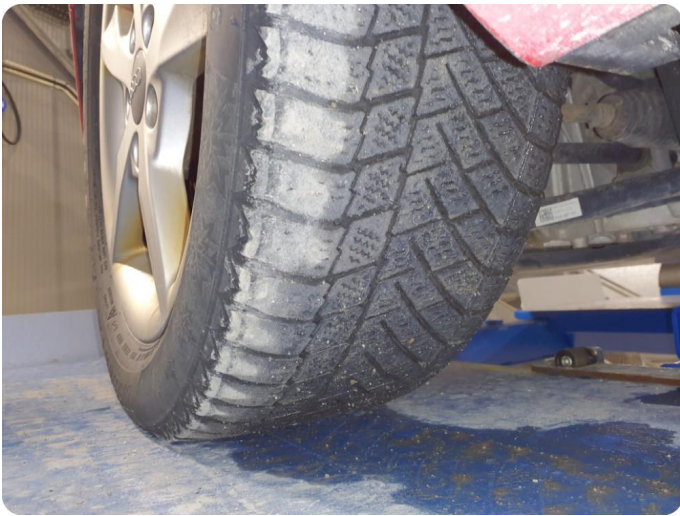
3.2 Skjev slitasje på vinterdekk