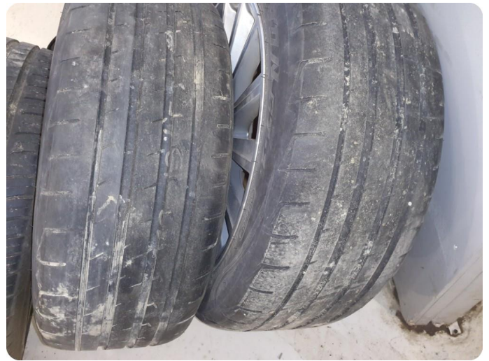
3.3 Skjev slitasje på sommerdekk To stk