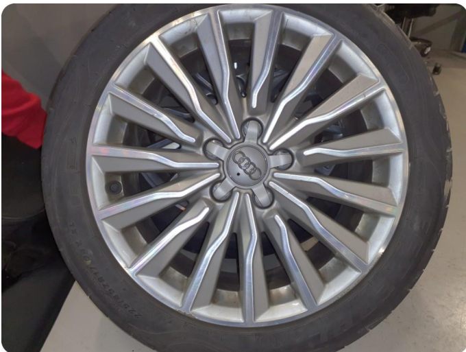
3.4 Kantkjørt felg Diamond Cut Tre stk sommer felg