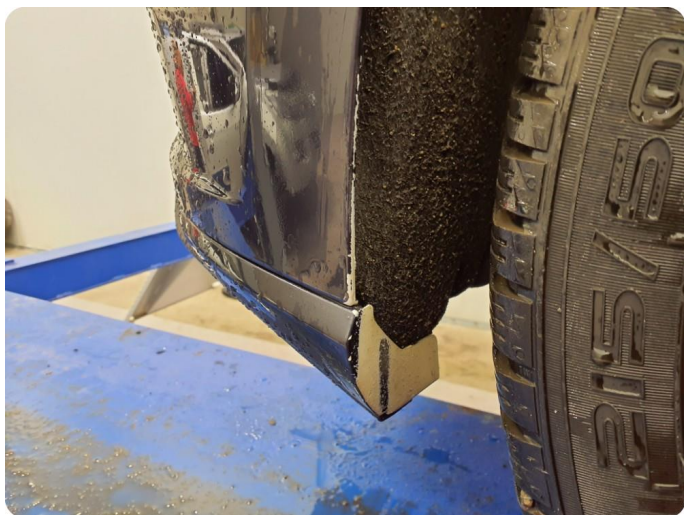
3.3 Lakk flasser