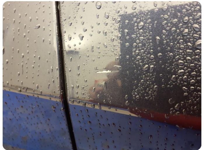
3.1 Ripe ned til grunning