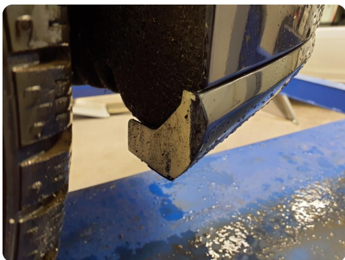
3.3 Lakk flasser