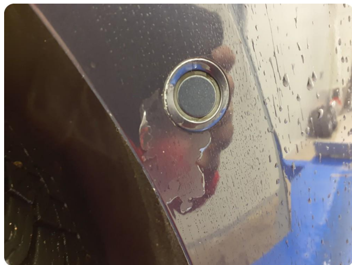
3.3 Lakk flasser