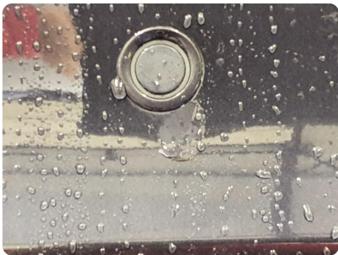
3.3 Lakk flasser