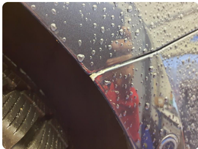
3.3 Lakk flasser