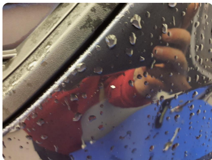
3.3 Lakk flasser