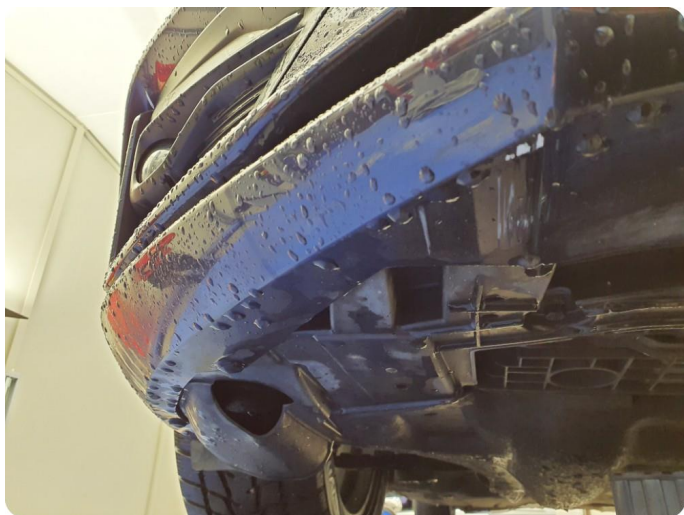
3.3 Lakk flasser