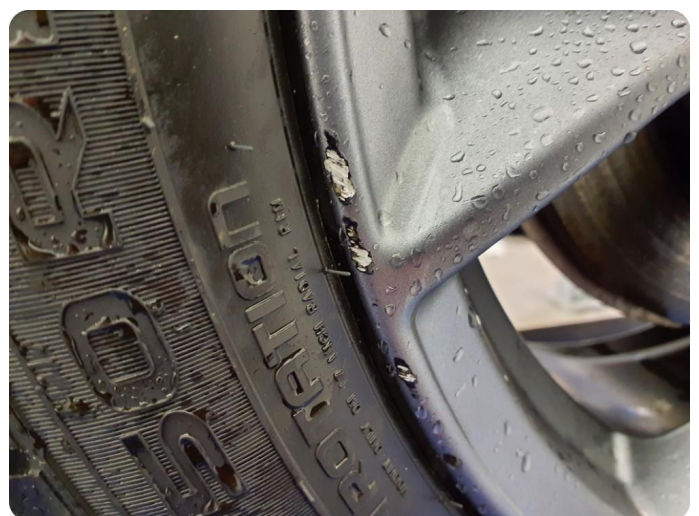
3.2 Kantkjørt felg 3 stk vinter