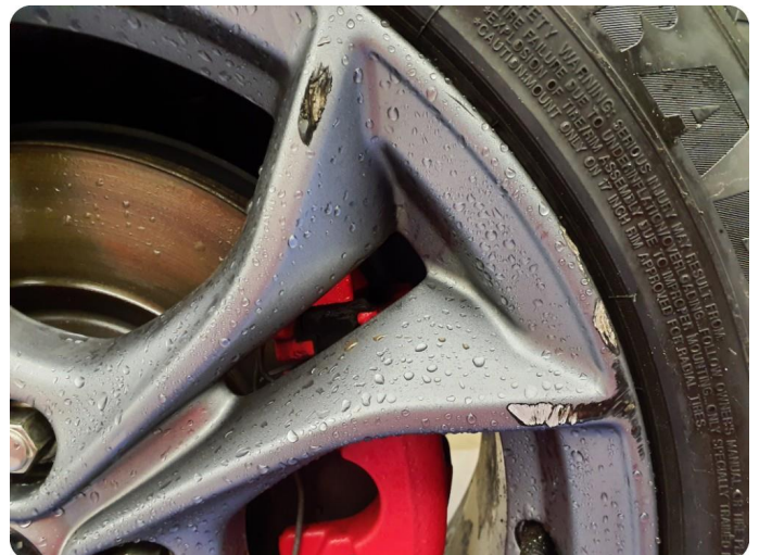
3.2 Kantkjørt felg 3 stk vinter