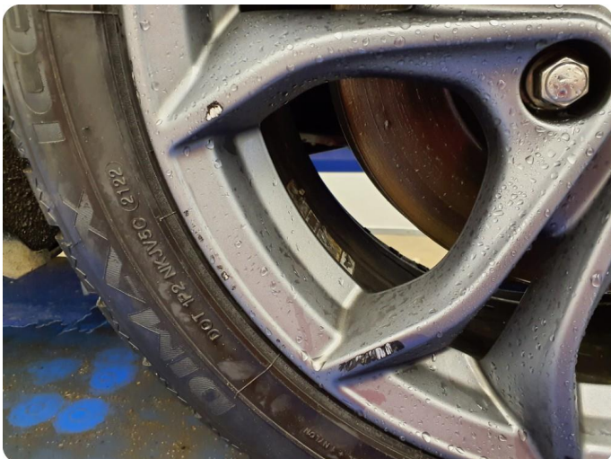
3.2 Kantkjørt felg 3 stk vinter