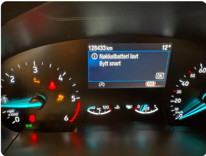
2.1 Varsellampe lyser se bilde Må kontrolleres.