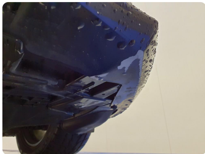
3.3 Lakk flasser