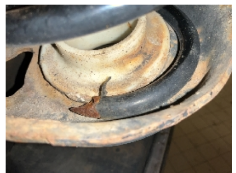
36. Fjærer / fjærbein