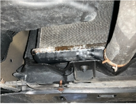
37. Utvendig tilstand motor