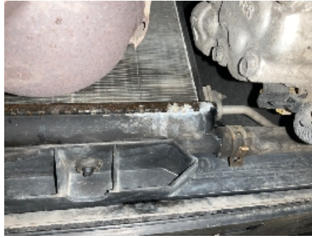
38. Utvendig tilstand motor