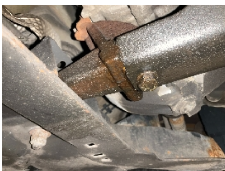
34. Utvendig tilstand motor