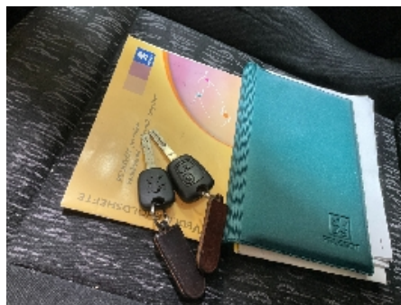
23. Nøkler / Utstyr