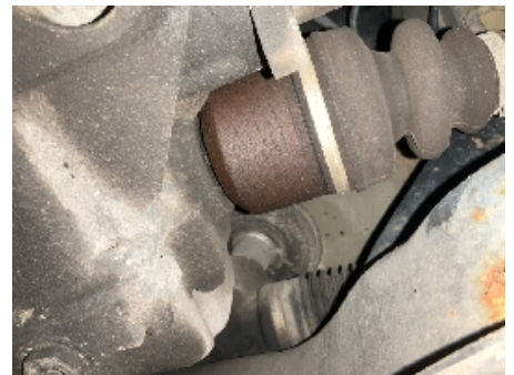
33. Girkasse (manuell)