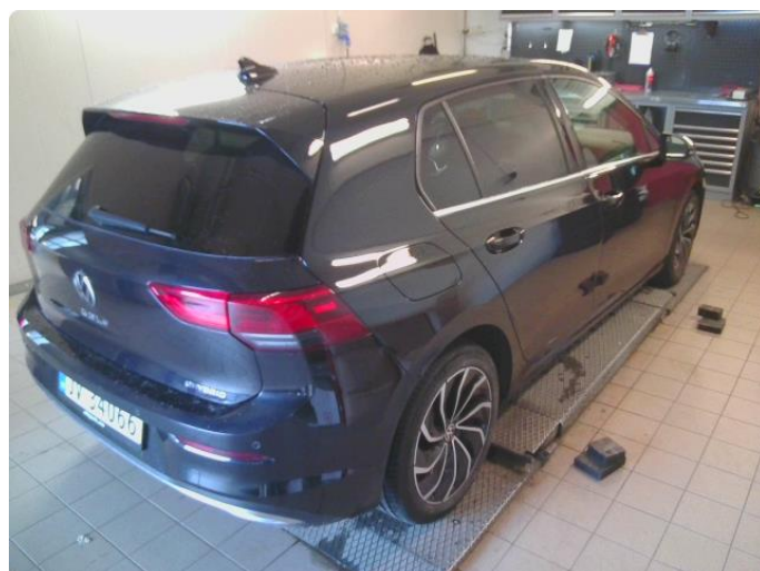
1.1 Bilder av bilen