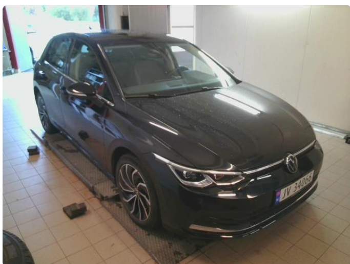
1.1 Bilder av bilen