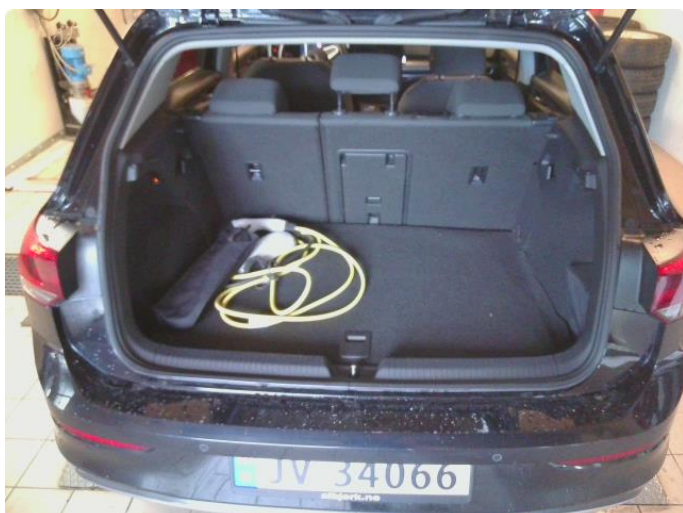
1.1 Bilder av bilen