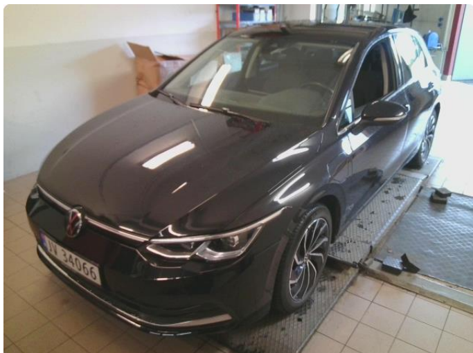
1.1 Bilder av bilen