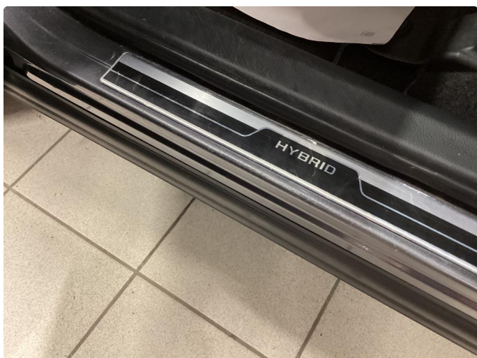
1.3 Slitt innsteg