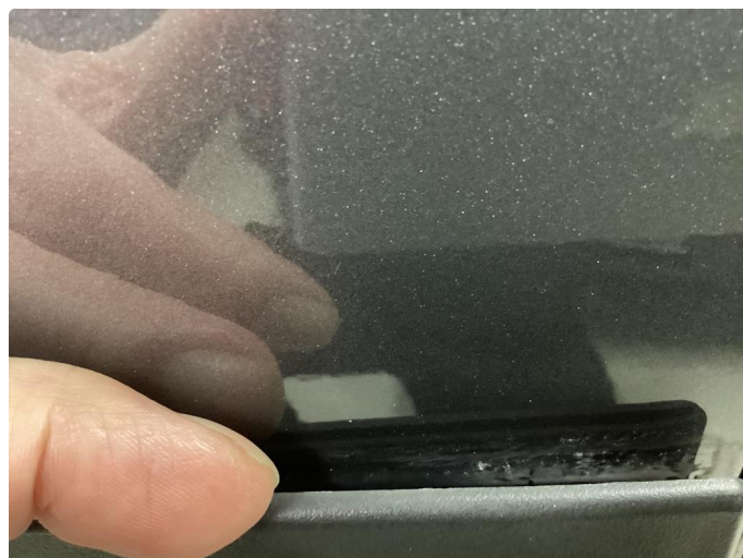
1.2 Løse/skadede lister