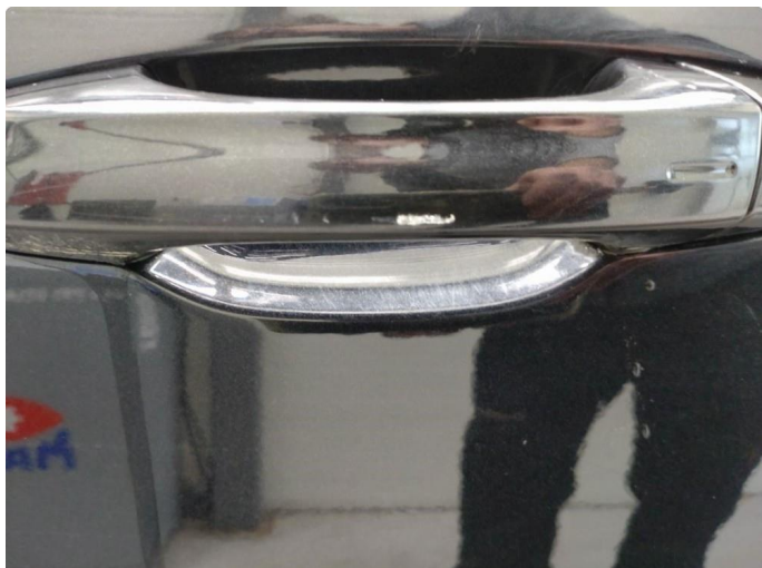
1.3 Håndtak lakkskadet/flasser