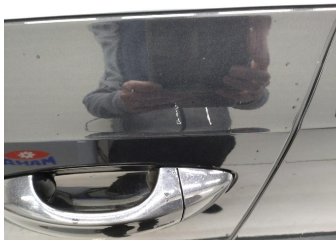
1.2 Ripe ned til grunning