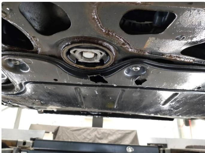
1.1 Beskyttelsesplate skadet/mangler