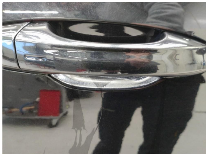
1.4 Håndtak lakkskadet/flasser