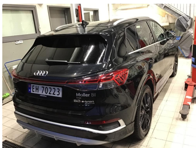
1.1 Øvrig opplysninger