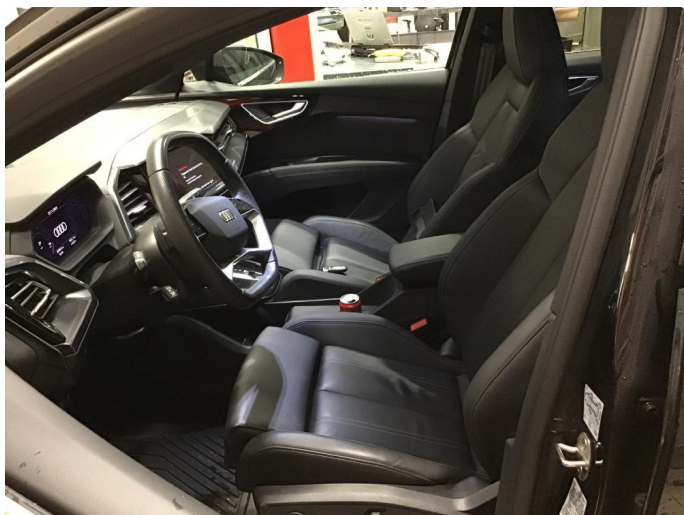
1.1 Øvrig opplysninger