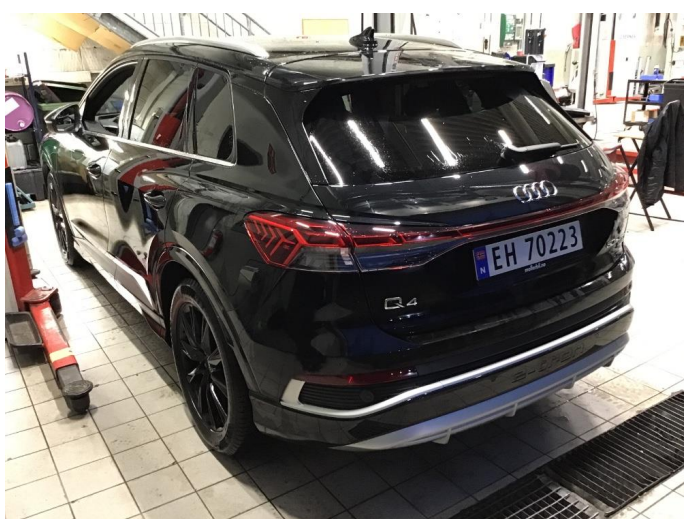
1.1 Øvrig opplysninger