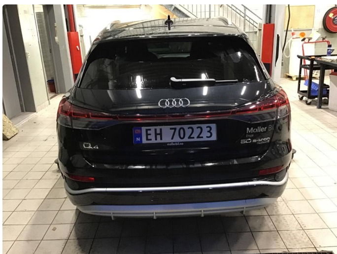
1.1 Øvrig opplysninger