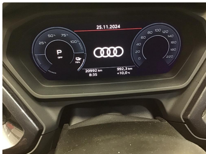
1.1 Øvrig opplysninger