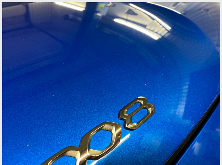
2.3 Steinsprut panser