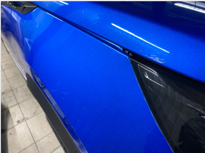
2.1 Noe lakkriper høyre side foran