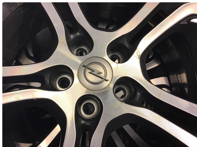
2.2 Påbegynnende oksidering