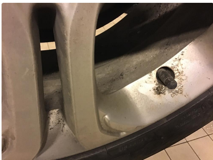
2.3 Påbegynnende oksidering