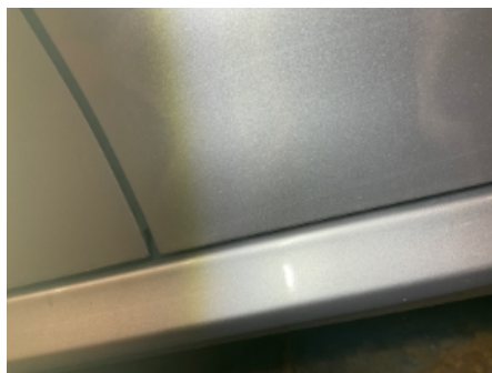
8. Lakk / karosseri utvendig