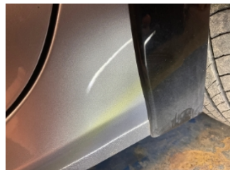
9. Lakk / karosseri utvendig