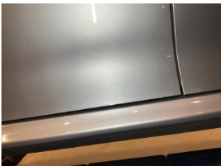
7. Lakk / karosseri utvendig