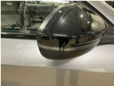
1. Utvendig speil