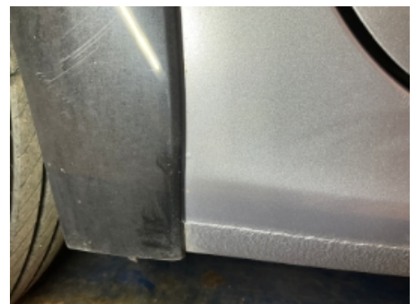
6. Lakk / karosseri utvendig