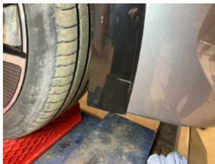
5. Lakk / karosseri utvendig