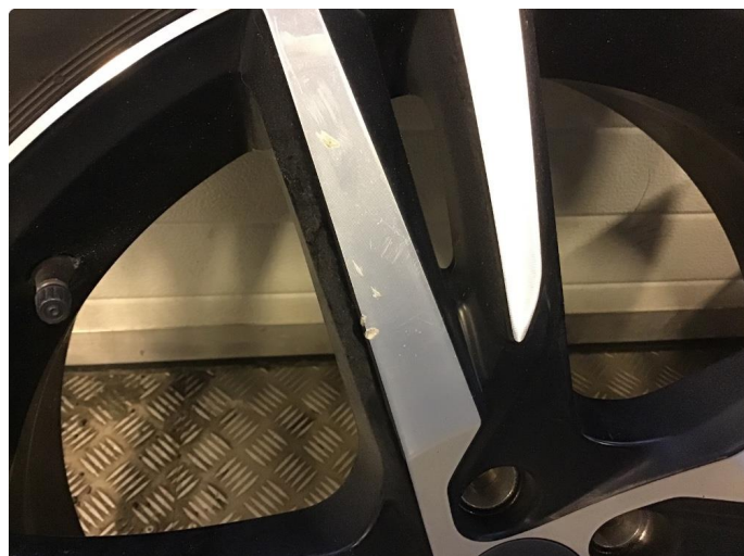
1.1 Skade på felg