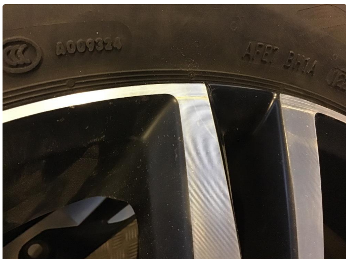
1.1 Skade på felg