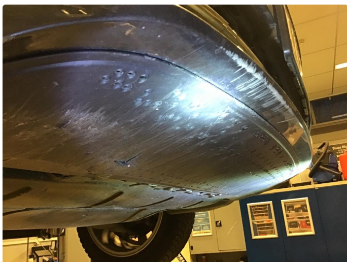
2.3 Skrubbskader underkant