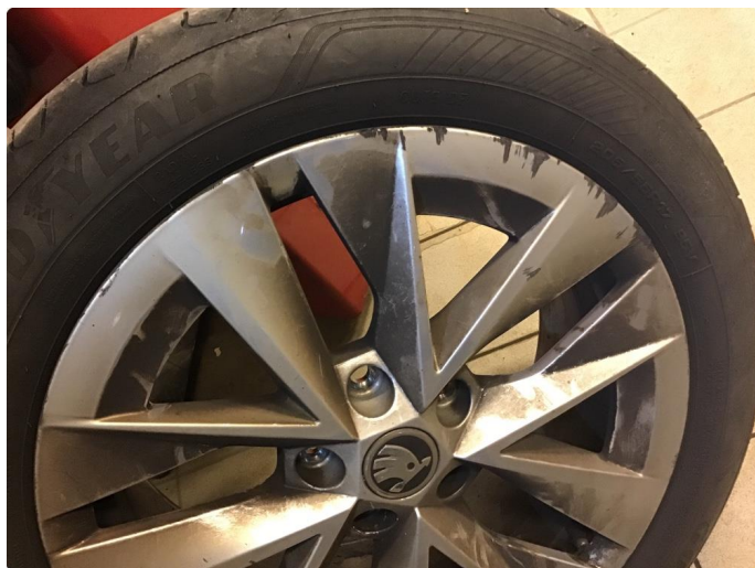
2.2 Kantkjørt felg