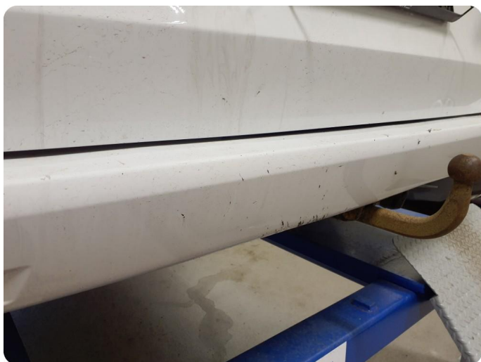
3.5 Ripe(r) ned til grunning Tillegg lakkflask og skade støtfanger foran