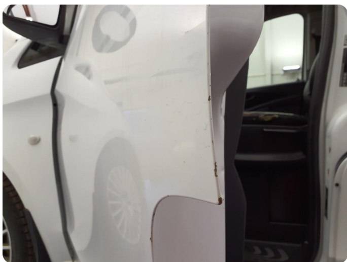
3.3 Ripe ned til grunning Tillegg rust og bulker