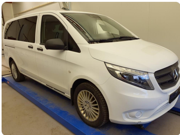
6.1 Fjerne limrester etter dekor/logo Generelt på alle flater på bil , må kontrolleres