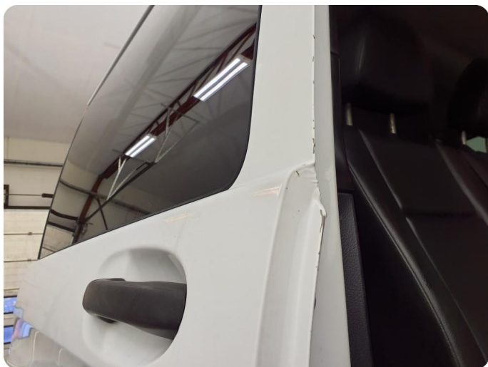
3.3 Ripe ned til grunning Tillegg rust og bulker