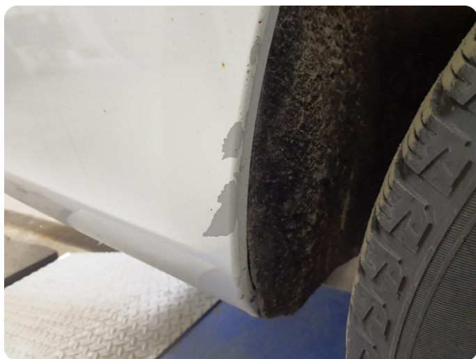
3.5 Ripe(r) ned til grunning Tillegg lakkflass og skade støtfanger foran