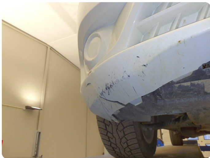
3.5 Ripe(r) ned til grunning Tillegg lakkflass og skade støtfanger foran