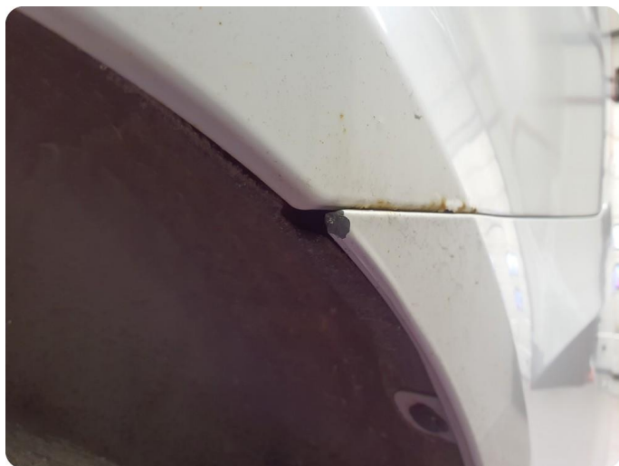
3.5 Ripe(r) ned til grunning Tillegg lakkflask og skade støtfanger foran