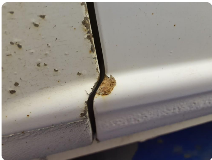
3.3 Ripe ned til grunning Tillegg rust og bulker