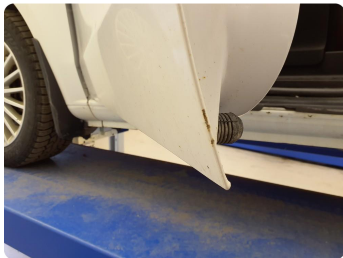
3.3 Ripe ned til grunning Tillegg rust og bulker