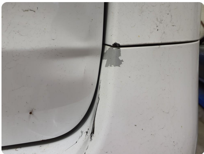
3.5 Ripe(r) ned til grunning Tillegg lakkflass og skade støtfanger foran