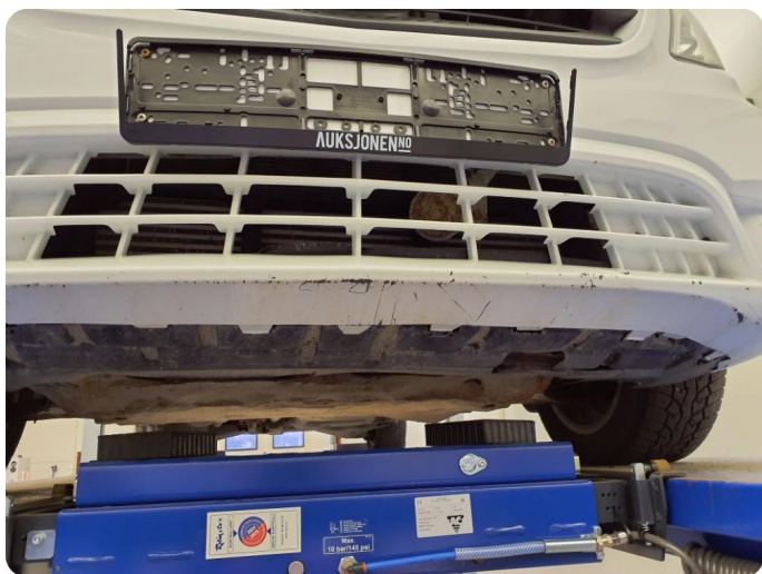
3.5 Ripe(r) ned til grunning Tillegg lakkflass og skade støtfanger foran