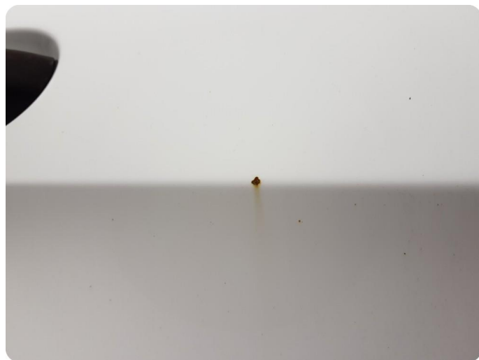
3.3 Ripe ned til grunning Tillegg rust og bulker