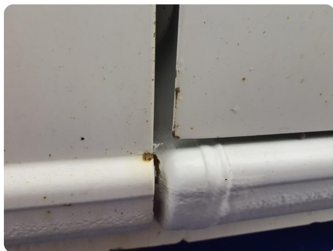
3.3 Ripe ned til grunning Tillegg rust og bulker