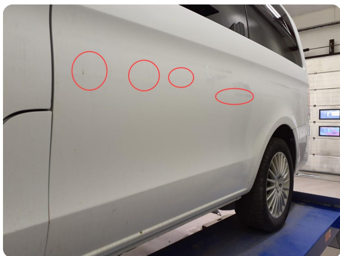
3.3 Ripe ned til grunning Tillegg rust og bulker