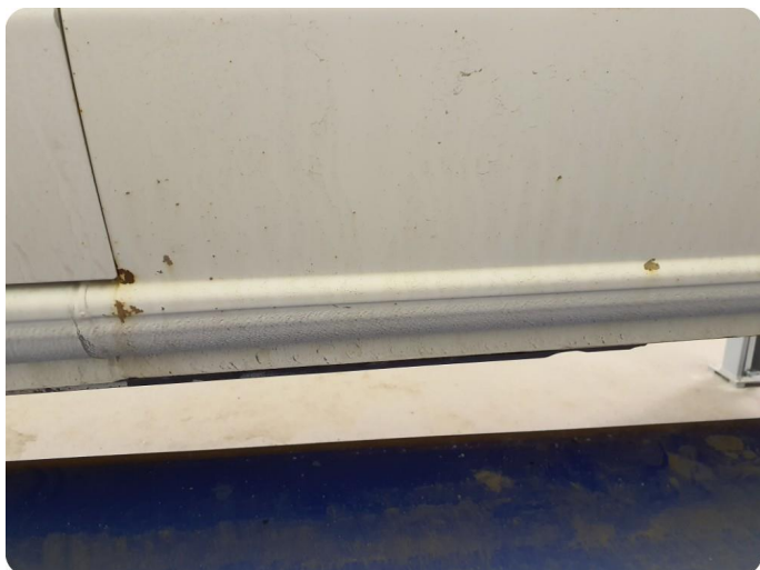
3.3 Ripe ned til grunning Tillegg rust og bulker