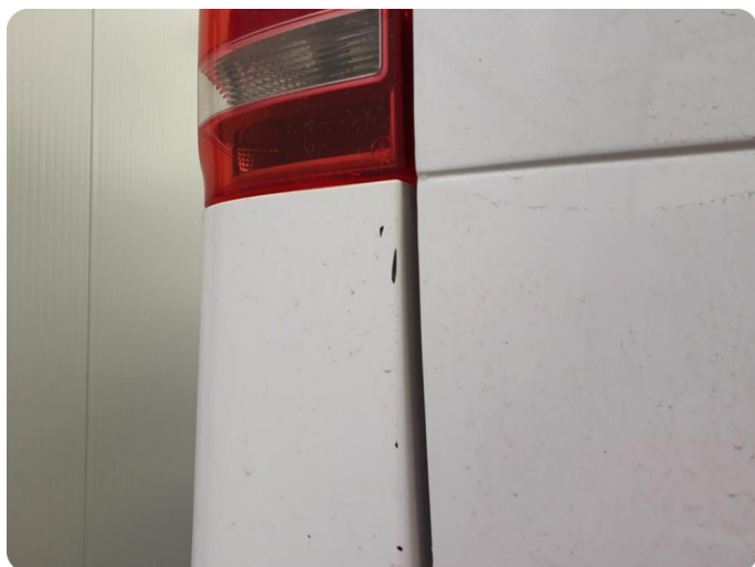
3.5 Ripe(r) ned til grunning Tillegg lakkflask og skade støtfanger foran