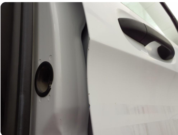
3.3 Ripe ned til grunning Tillegg rust og bulker