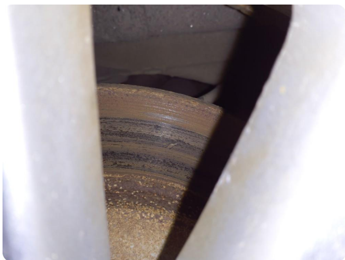
4.1 Rust Tillegg slitekant foran