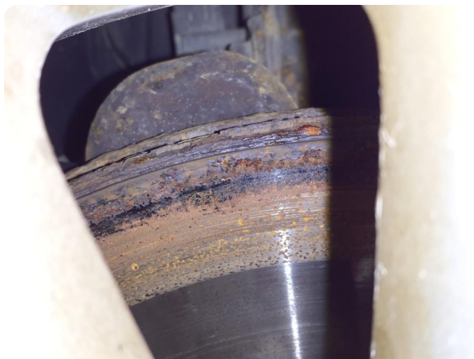
4.1 Rust Tillegg slitekant foran