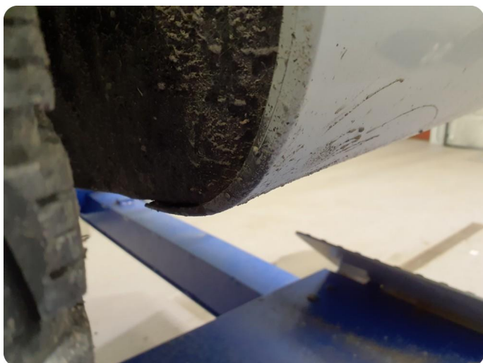
3.5 Ripe(r) ned til grunning Tillegg lakkflask og skade støtfanger foran