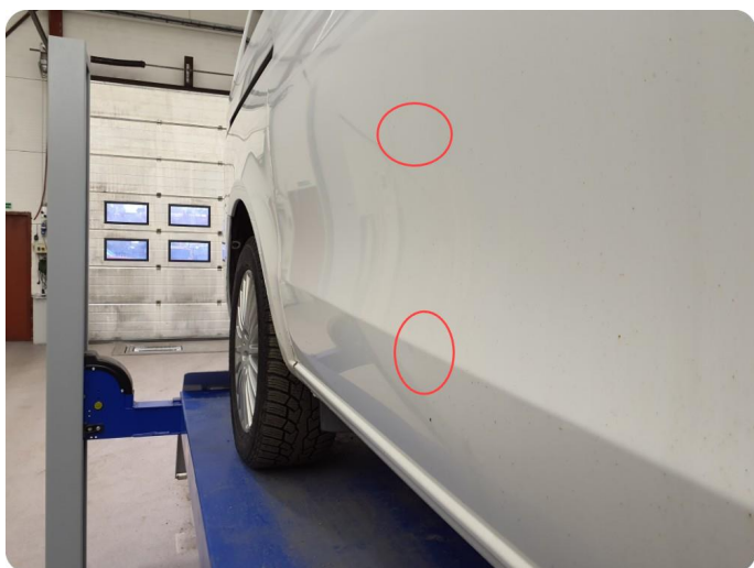
3.3 Ripe ned til grunning Tillegg rust og bulker