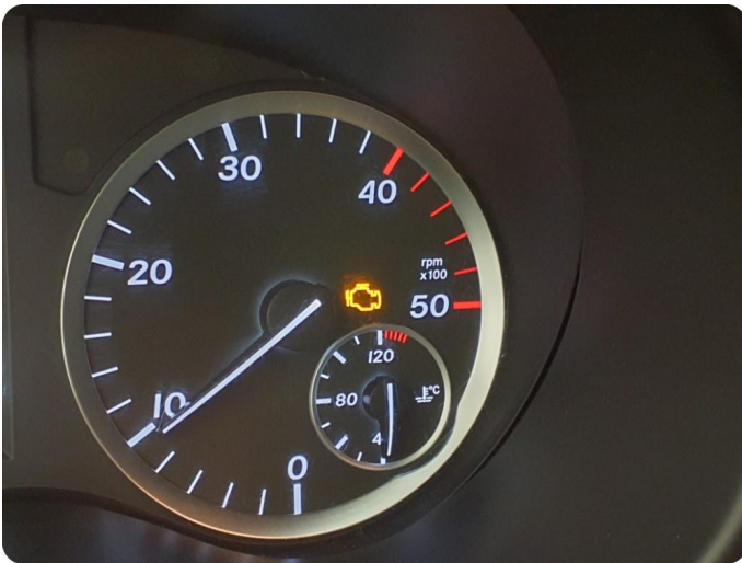
2.1 Varsellampe lyser se bilde Motorlampe lyser , må kontrolleres