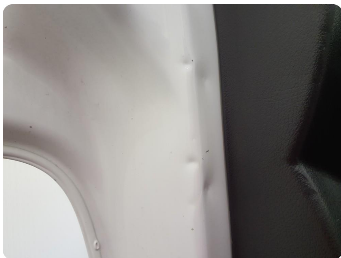
3.3 Ripe ned til grunning Tillegg rust og bulker