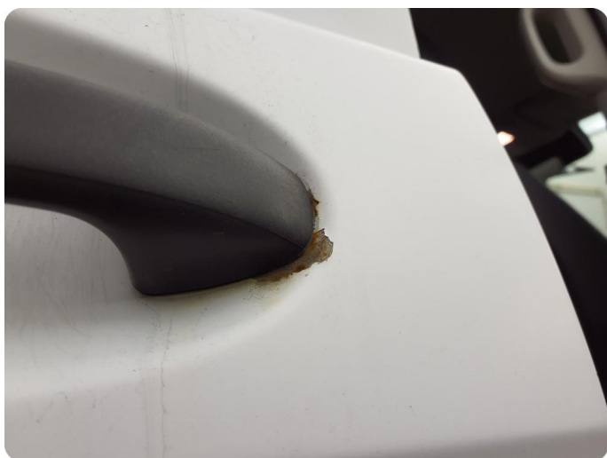
3.3 Ripe ned til grunning Tillegg rust og bulker