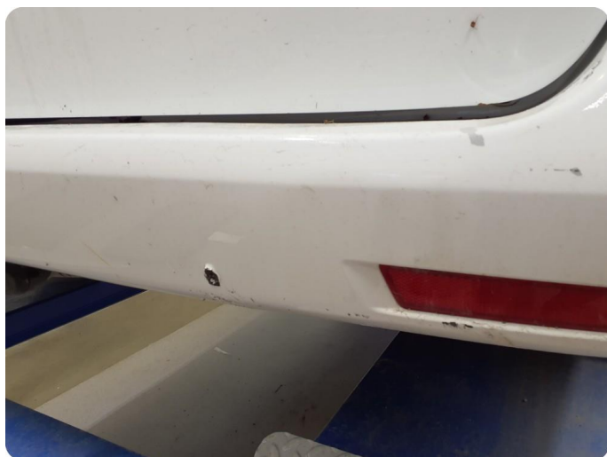
3.5 Ripe(r) ned til grunning Tillegg lakkflask og skade støtfanger foran