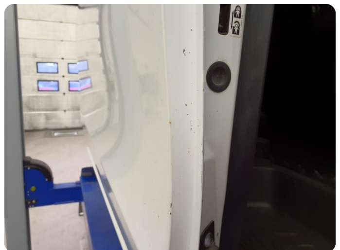
3.3 Ripe ned til grunning Tillegg rust og bulker