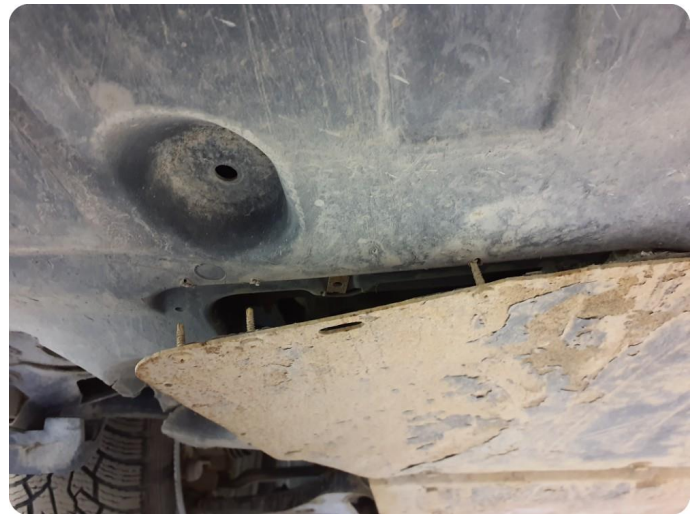
3.1 Beskyttelsesplate skadet/mangler