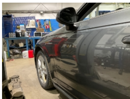
23. Lakk / karosseri utvendig