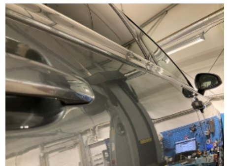
9. Høyre bakdør