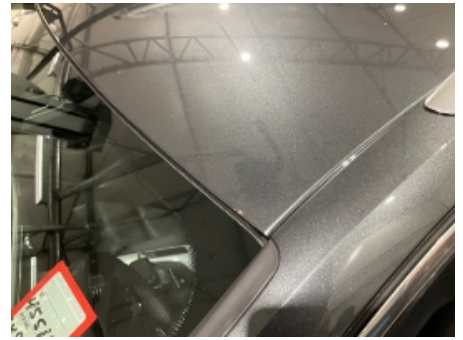
27. Lakk / karosseri utvendig