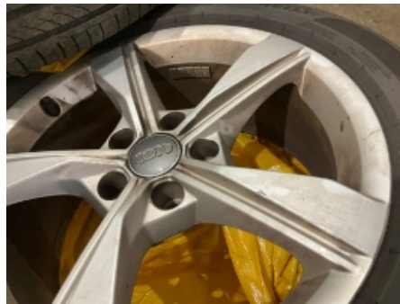
17. Ekstra hjulsett