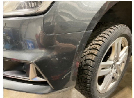
3. Støtfanger foran