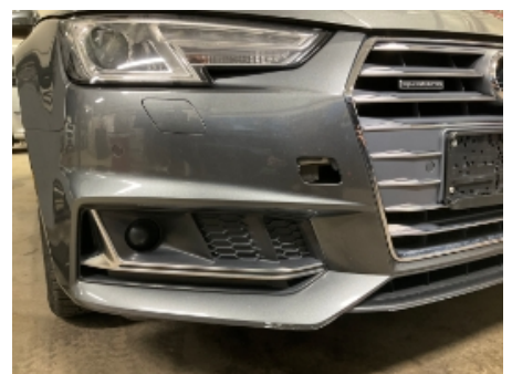
24. Lakk / karosseri utvendig