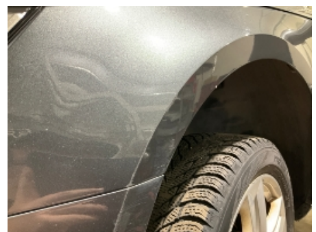
6. Venstre forskjerm