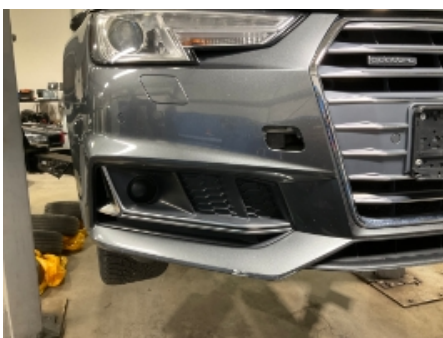
4. Støtfanger foran