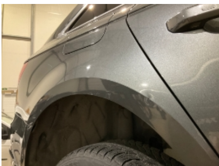
10. Høyre bakskjerm