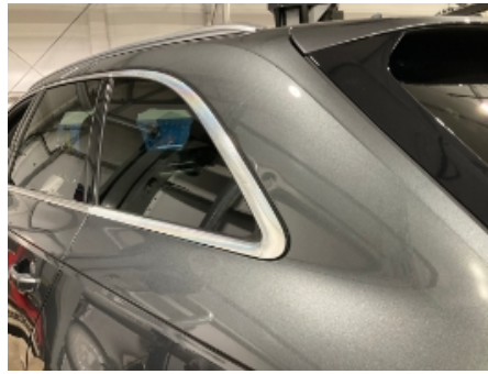
14. Venstre bakskjerm