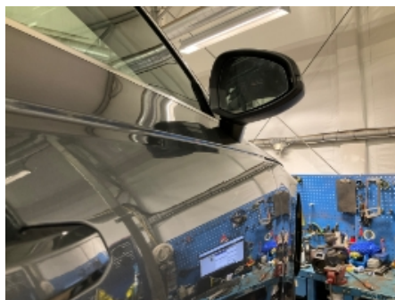
8. Høyre fordør