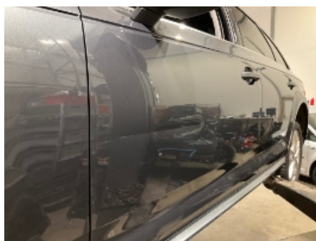
5. Venstre fordør