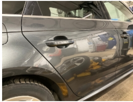
26. Lakk / karosseri utvendig