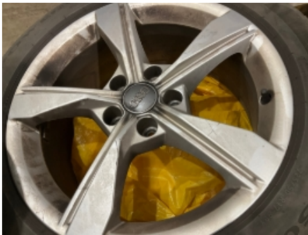
16. Ekstra hjulsett