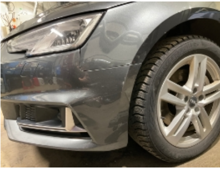
25. Lakk / karosseri utvendig