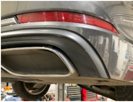
13. Støtfanger bak