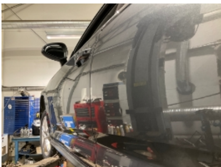
7. Venstre bakdør