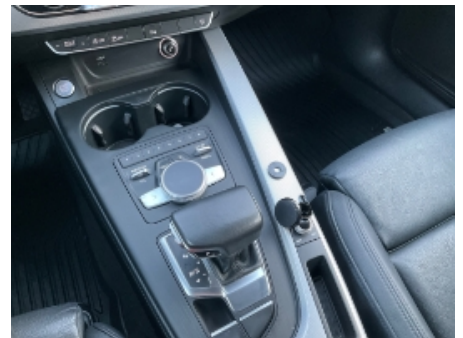
45. Interiør generelt