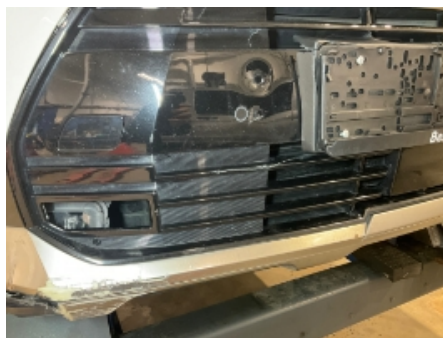
5. Lakk / karosseri utvendig