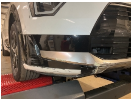
4. Lakk / karosseri utvendig