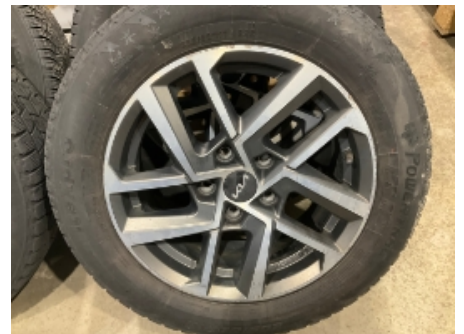
12. Ekstra hjulsett