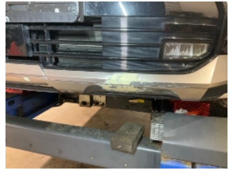
3. Lakk / karosseri utvendig