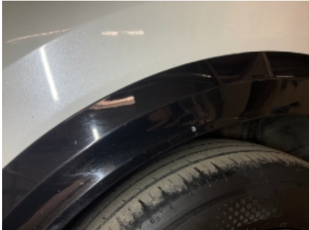
7. Lakk / karosseri utvendig