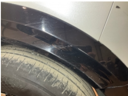
10. Lakk / karosseri utvendig