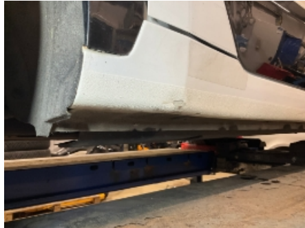
8. Lakk / karosseri utvendig