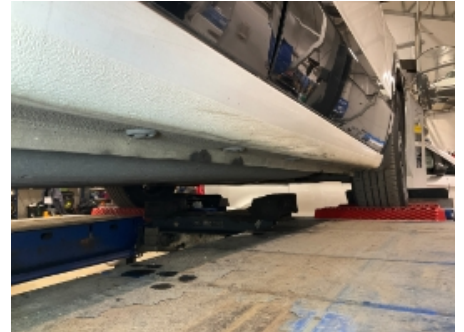
9. Lakk / karosseri utvendig