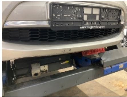
2. Lakk / karosseri utvendig