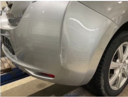
1. Lakk / karosseri utvendig