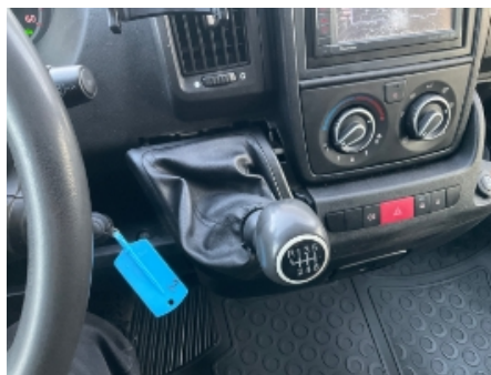
5. Interiør generelt