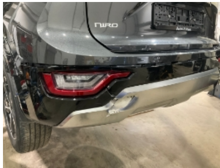
17. Lakk / karosseri utvendig