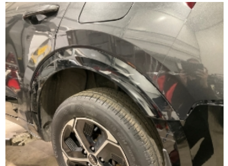
18. Lakk / karosseri utvendig