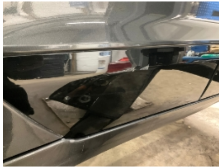
14. Lakk / karosseri utvendig