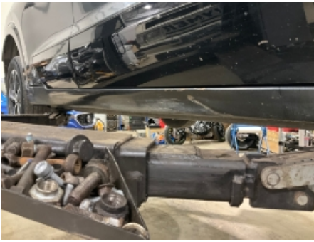
13. Lakk / karosseri utvendig