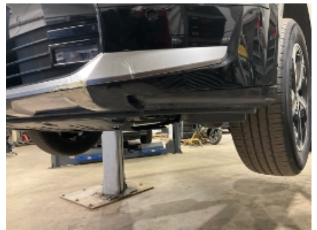
12. Lakk / karosseri utvendig