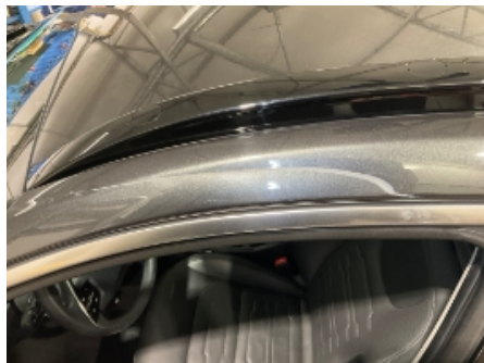
11. Lakk / karosseri utvendig