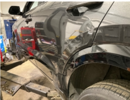
19. Lakk / karosseri utvendig