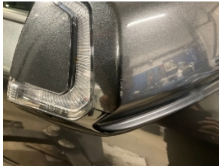
2. Utvendig speil