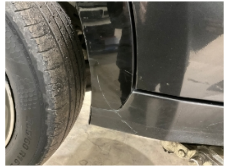
15. Lakk / karosseri utvendig