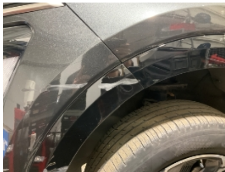
20. Lakk / karosseri utvendig