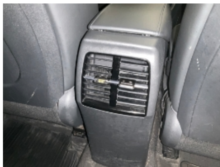
5. Luftdyse kupé