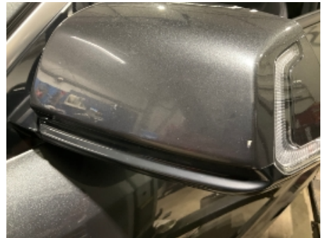
3. Utvendig speil