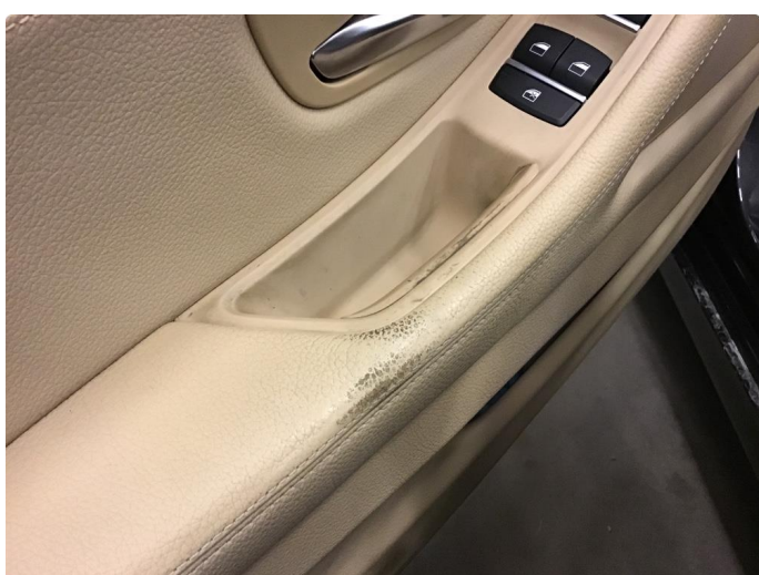
2.1 Øvrige feil