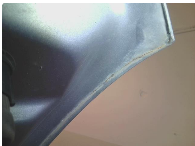
1.6 Rust i fals