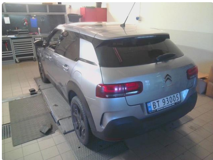
2.1 Øvrig opplysninger