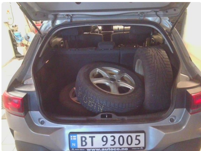
2.1 Øvrig opplysninger