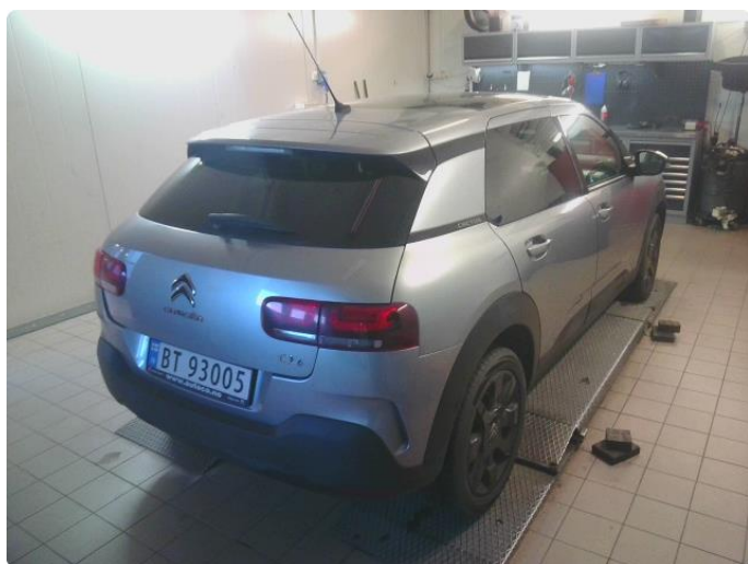
2.1 Øvrig opplysninger