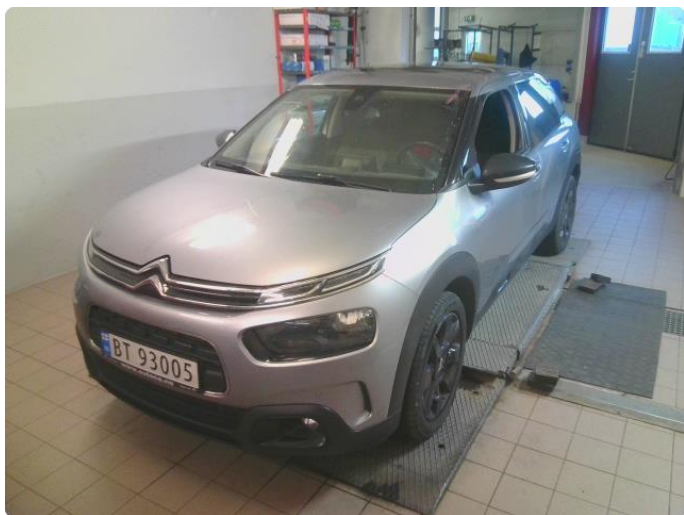
2.1 Øvrig opplysninger