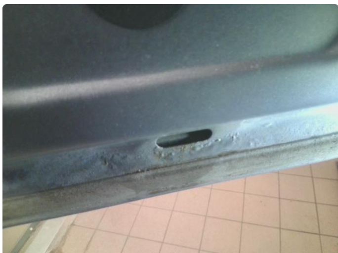
1.2 Rust i fals