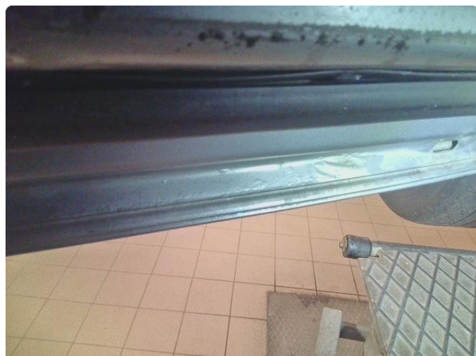
1.2 Rust i fals