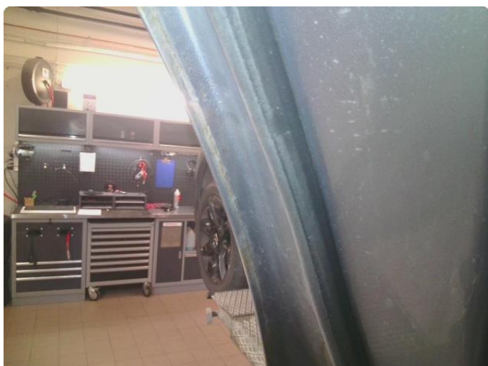
1.3 Rust i fals