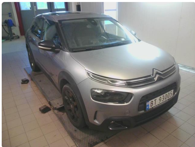
2.1 Øvrig opplysninger