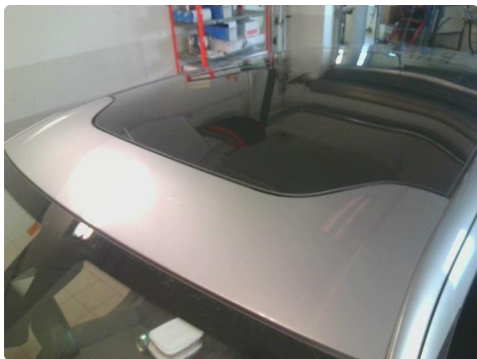
1.8 Steinsprut med rust