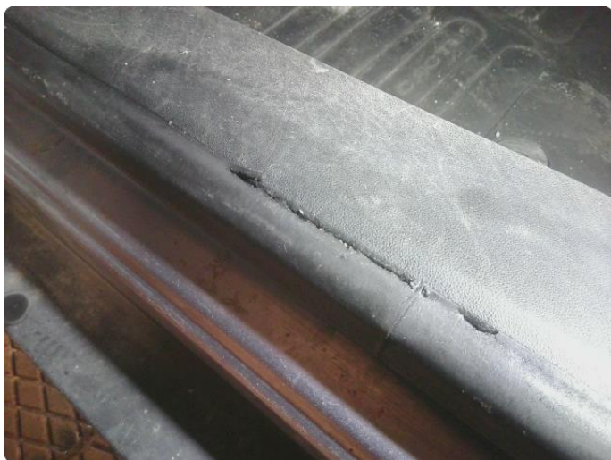
1.7 Skadet list