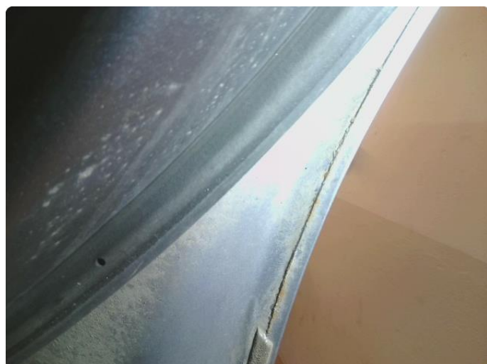
1.4 Rust i fals