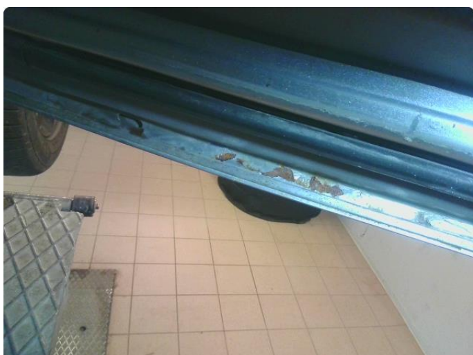
1.5 Rust i fals