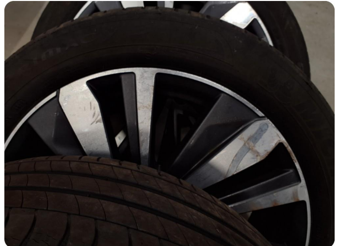
2.5 Kantkjørt felg Tre sommer