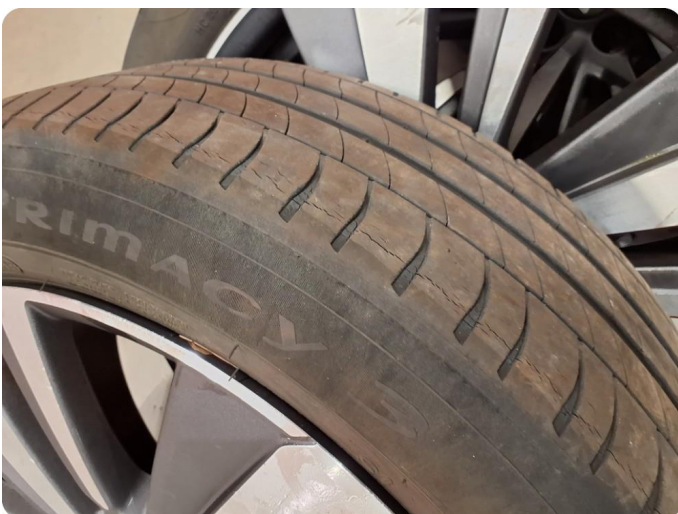
2.6 Øvrige feil Sprekker i sommerdekk