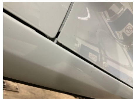
6. Lakk / karosseri utvendig