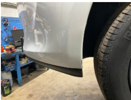
4. Lakk / karosseri utvendig