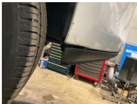
5. Lakk / karosseri utvendig