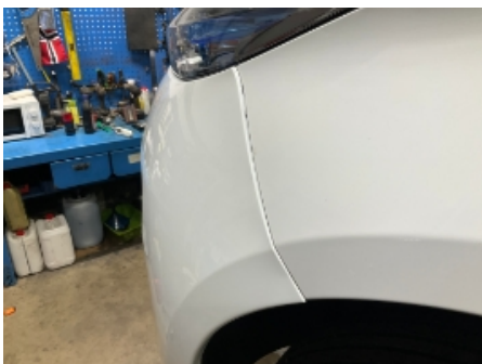
7. Lakk / karosseri utvendig