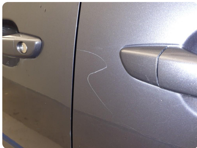
2.4 Riper Tillegg bulk, steinsprut