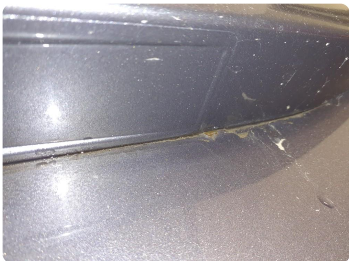
2.5 Ripe(r) Tillegg lakk flasser