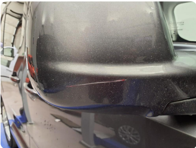
2.7 Speilhus riper