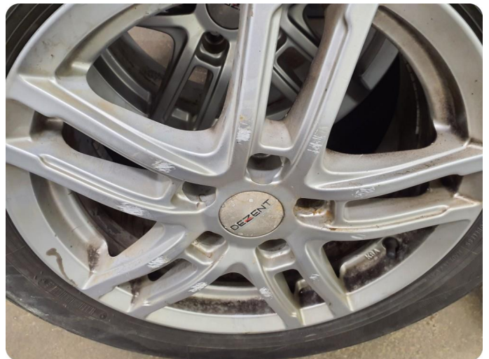
2.8 Kantkjørt felg 1 av 4 vinterfelg