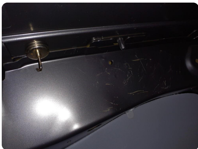
4.1 Øvrige feil Merker, riper, bulk