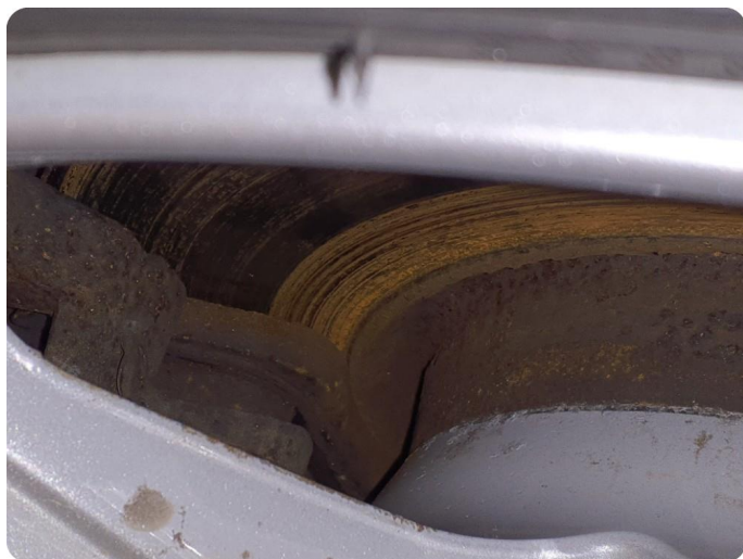
3.1 Slitte klosser