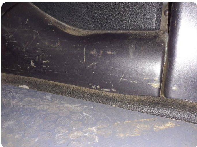
4.1 Øvrige feil Merker, riper, bulk