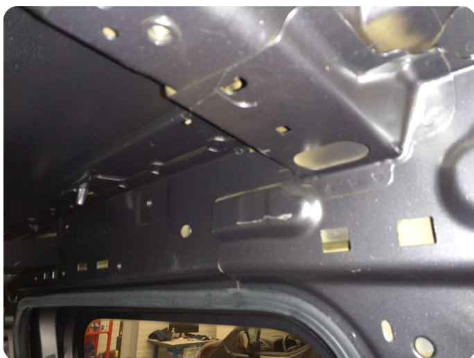
4.1 Øvrige feil Merker, riper, bulk