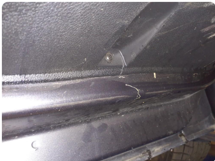
2.3 Riper Inside