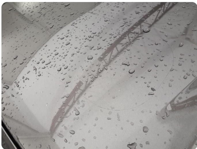
5.1 Fjerne limrester etter dekor/logo Panser dører foran