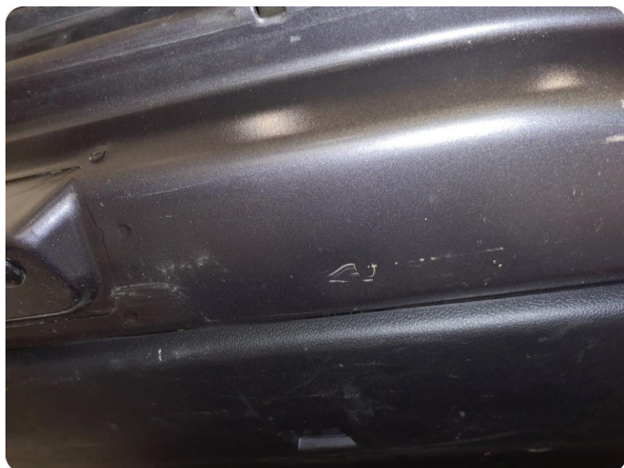
4.1 Øvrige feil Merker, riper, bulk