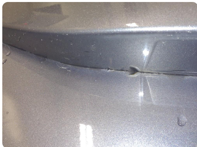
2.5 Ripe(r) Tillegg lakk flasser