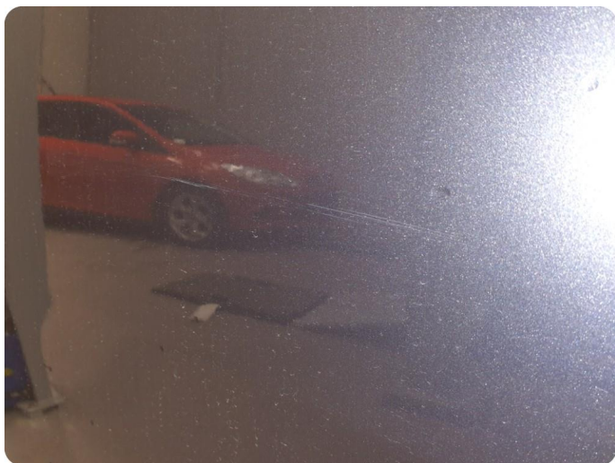
2.4 Riper Tillegg bulk, steinsprut