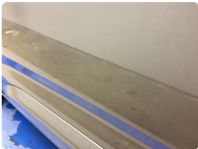
5.1 Fjerne limrester etter dekor/logo Panser dører foran