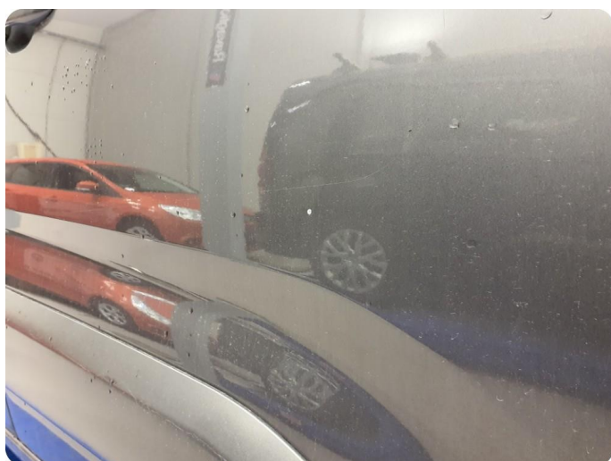
2.4 Riper Tillegg bulk, steinsprut