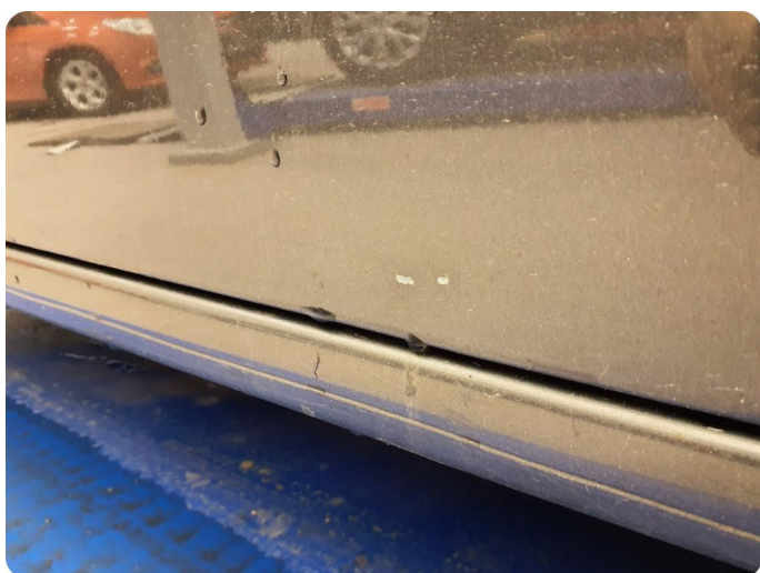
2.4 Riper Tillegg bulk, steinsprut