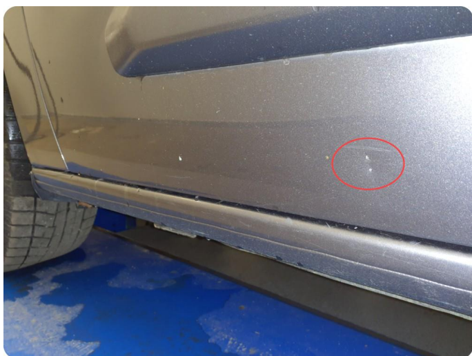
2.4 Riper Tillegg bulk, steinsprut