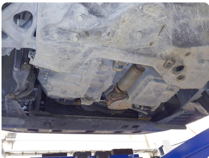
2.1 Beskyttelsesplate skadet/mangler Mangler deksel under motor