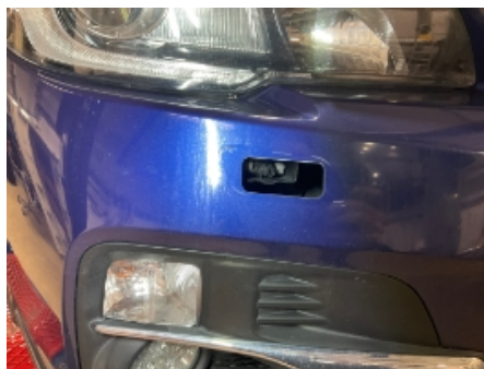
5. Lyktespyler / Visker