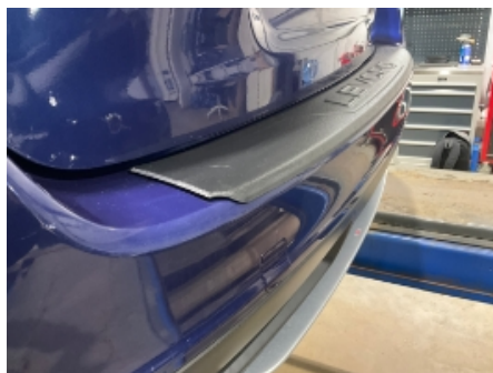
8. Lakk / karosseri utvendig