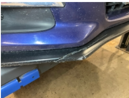
4. Lakk / karosseri utvendig