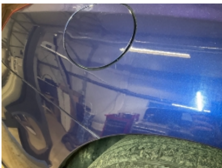
7. Lakk / karosseri utvendig