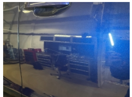
6. Lakk / karosseri utvendig