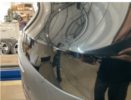
4. Lakk / karosseri utvendig