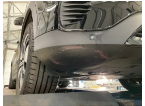
3. Lakk / karosseri utvendig