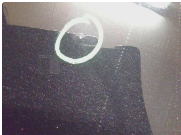
1.1 Steinsprut med lakkskade