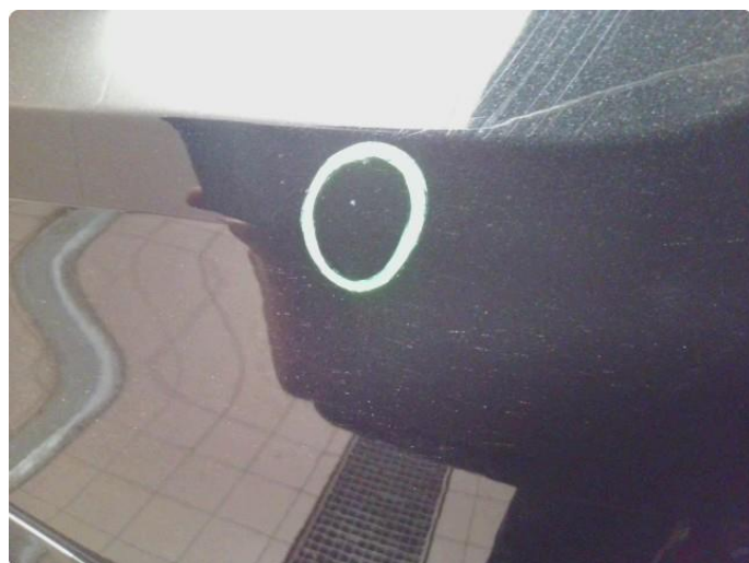
1.2 Noe steinsprut