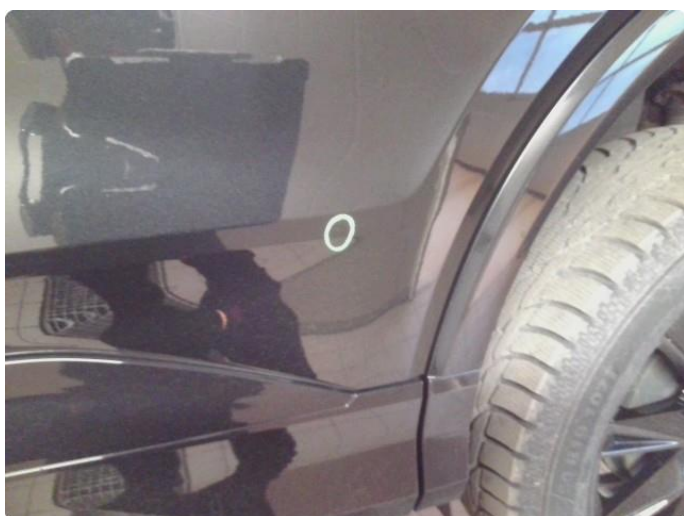
1.2 Noe steinsprut