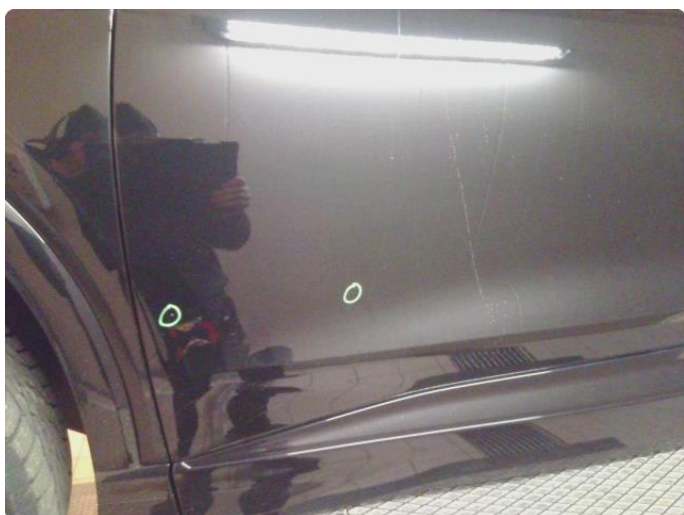
1.1 Steinsprut med lakkskade